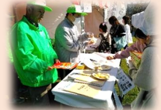
【ふるさとまつりにて防災啓発活動】

中央市災害ボランティア連絡会は、平成22年12月に発足し、15年目を迎えました。会員数は20名(男女各10名)で、当会の目的は災害ボランティアセンターへの運営協力、当会員のスキルアップ研修、地域住民への防災啓発活動、各団体との交流活動などです。