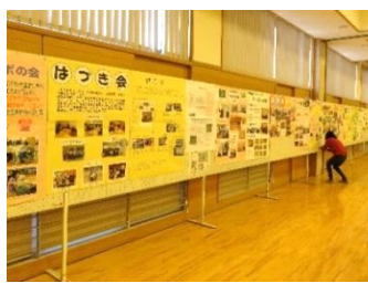
※以前開催した交流会の様子の写真です