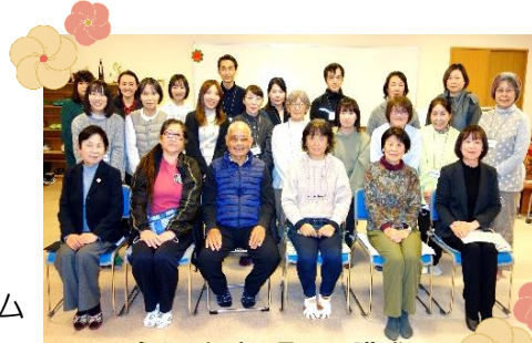
令和4年度2月 閉講式