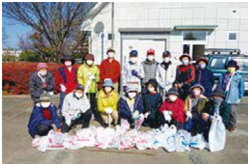
環境整備 11/17 (水) ことぶきマスター連絡協議会