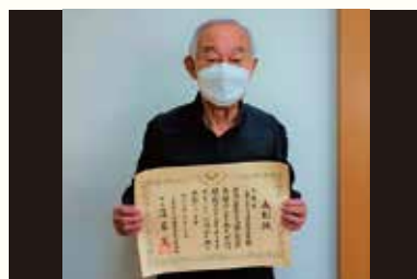
全国老人クラブ連合会会長表彰 優良老人クラブ表彰 田富支会

中央市ことぶきクラブ連合会は、様々な活動が認められ受賞したり、スポーツ大会では、実力を発揮し、みごと優勝したりと、とても活発なクラブです！