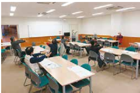
「地域サロン・集いの場」きっかけ講座 12/1 (水)・7日 (火)・15 (水) 玉穂総合会館