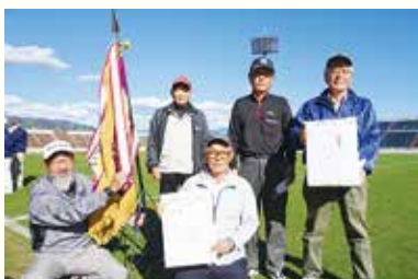
山梨県老人クラブ連合会主催 第14回グラウンドゴルフ大会 優勝