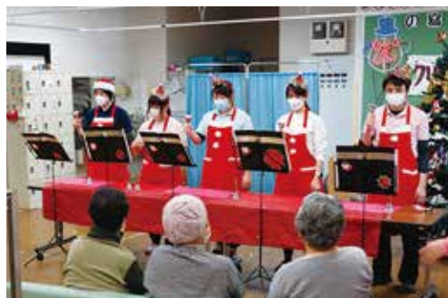
クリスマス会 12/13 (月) シルクの里デイサービスセンター