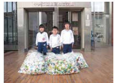
みかさこども園のおともだち