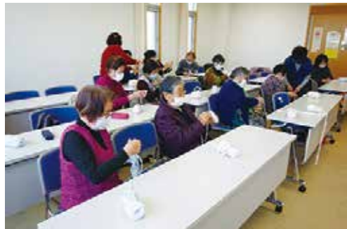
指あみマフラー教室 11/30 (火)・12/9 (木) ことぶきマスター連絡協議会