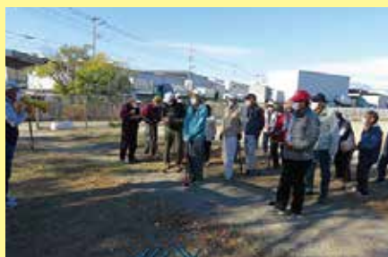
GG交流会 11/24 (火) ことぶきマスター連絡協議会