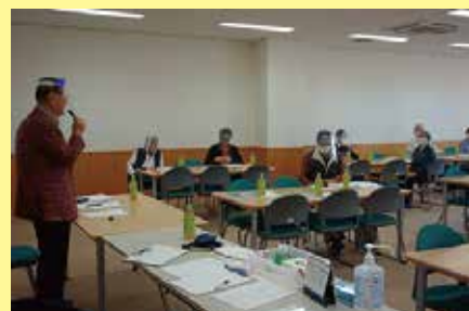
ことぶきクラブでは感染対策として 会議等でフェイスシールド着用中