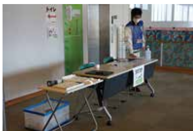
入場時には検温を行いました