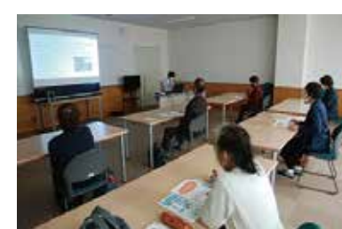
支えあい勉強会 11/26 (木) 玉穂総合会館