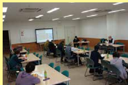
県政出張講座 11/13 (金) ことぶきマスター連絡協議会