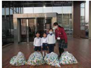
みかさこども園のおともだち