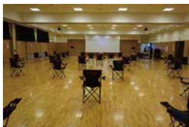
距離を保って席を配置しました

今後もこのようなイベントを開催していきたいと考えておりますので、「社協だよりぬくぬく」及び「ボランティアだより」をチェックしてみてください。