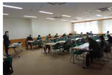
初心者向けスマホ教室 11/5 (木)・27 (金) 健康まなびや