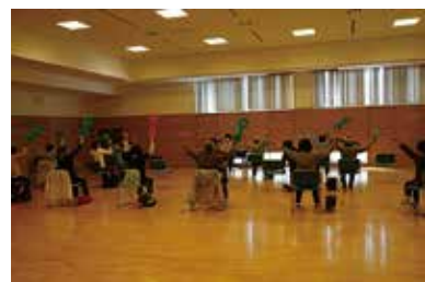
3B体操教室 11/4 (水) 健康まなびや