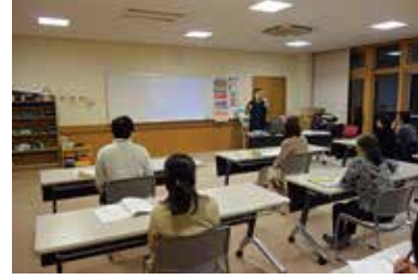
手話奉仕員養成講座（座学編） 11/20 (金) 玉穂総合会館