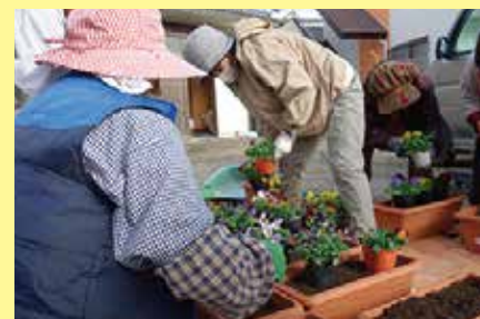
花植え 12/4 (金) ことぶきクラブ玉穂支会 西新居自治会