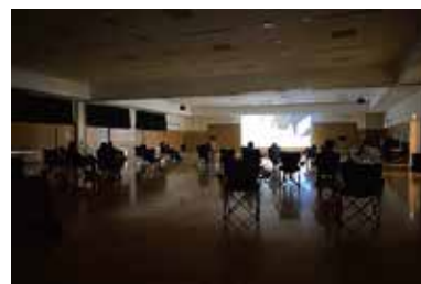
換気に配慮しながら上映しました