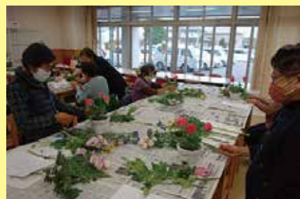
フラワーアレンジメント教室 11/27 (金) ことぶきクラブ玉穂支会