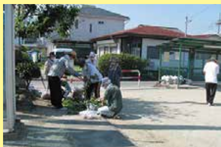
草取り 8/22 (土) ことぶきクラブ田富支会 桜自治会