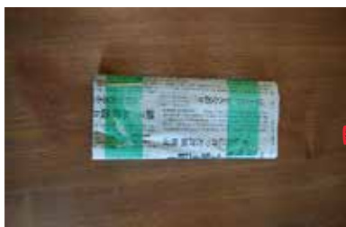
④ガムテープを巻く これを2部作る