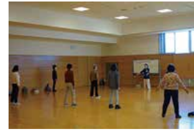
太極拳教室 11/24 (火) 健康まなびや