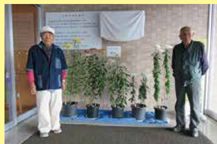
菊の会 10/30 (金) ことぶきクラブ連合会（部活動）