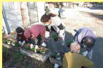
花植え 11/26 (木) ことぶきクラブ豊富支会 角川地区