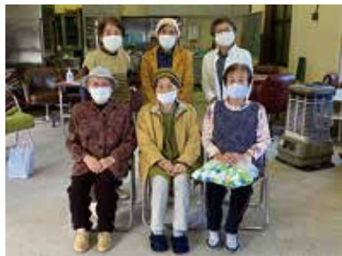
宇山・高部・新道百歳体操の皆さん