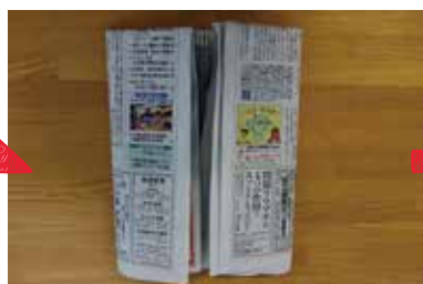
②両端を中心に折り込む