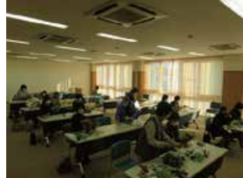
手芸教室「リース作り」 11/17 (火) 健康まなびや