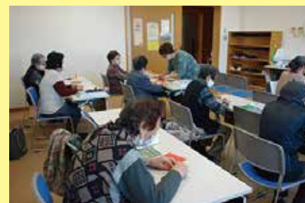
おりがみ教室 11/17 (火) ことぶきクラブ玉穂支会