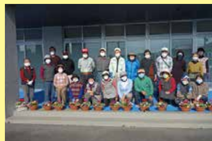
寄せ植え教室 11/19 (木) ことぶきマスター連絡協議会