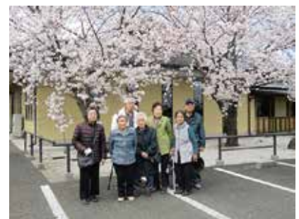
花見 ふれあいサロン中央 4/2(火) 妙泉寺