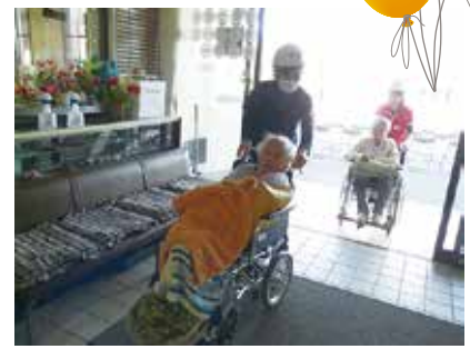
避難訓練 3/18(月) シルクの里デイ・まゆっこ広場