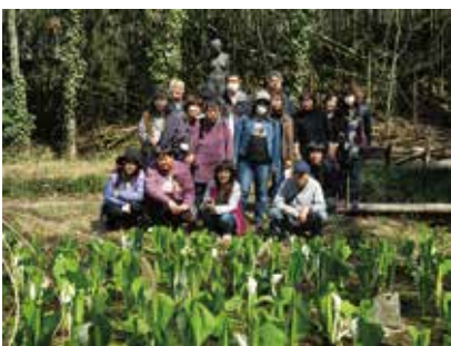
花見 地域活動支援センターちゅうおう 3/20(水) 藤壘の滝