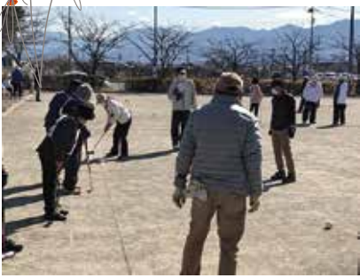
ふれあい福祉ゲートボール大会 3/14(木) 田富福祉公園ゲートボール場