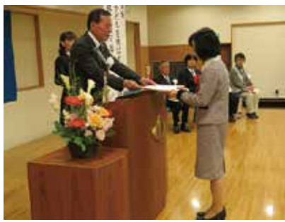
中央市社会福祉大会 3/17(日) 玉穂総合会館