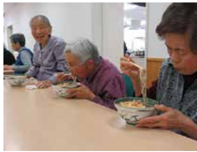
やまだ亭 慰問(手打ちそば) サロン・地活合同 3/27(水) 玉穂総合会館