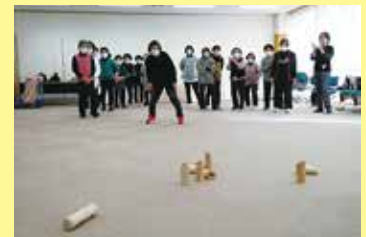
モルック体験 1/21（火） ことぶきクラブ玉穂支会