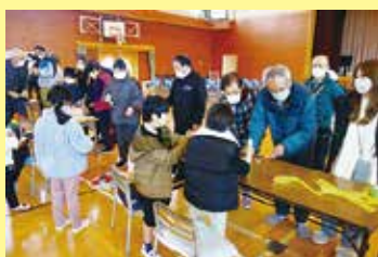
昔のあそび教室 1/23（木） ことぶきマスター連絡協議会