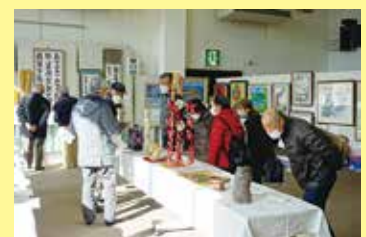
峡中地区高齢者作品展 2/7（金） 竜王南部公民館