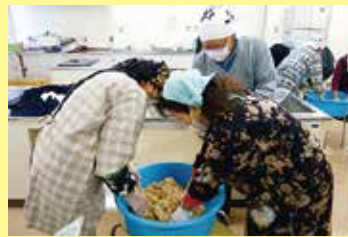
みそづくり交流会 1/21（火） ことぶきマスター連絡協議会