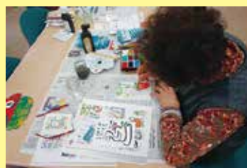
絵手紙教室 1/31（金） ことぶきクラブ玉穂支会女性部