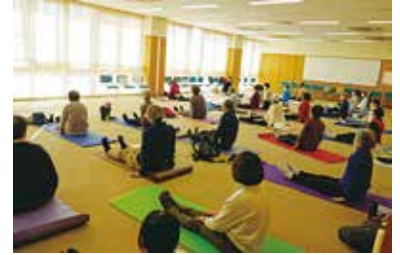
健康まなびや「ヨガ教室」 1/23（木） 玉穂総合会館