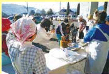
多世代交流会（もちつき） 1/8（水） ことぶきマスター連絡協議会