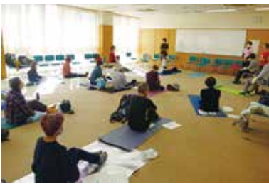
健康まなびや「自彊術教室」 1/29（水） 玉穂総合会館