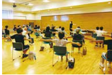
健康まなびや 「心と体の健康体操教室」 1/15（水）玉穂総合会館