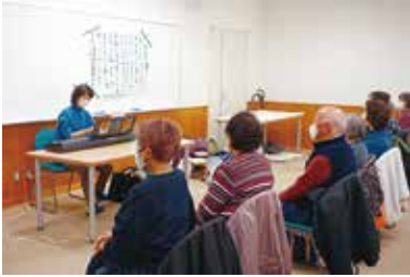
健康まなびや「音楽療法教室」 1/8（水） 玉穂総合会館