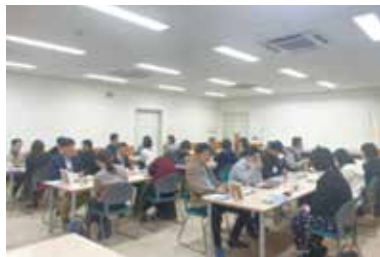
婚活パーティー 3/15 (土) 玉穂総合会館