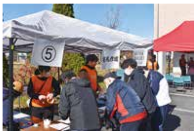
災害ボランティアセンター 運営協力員養成講座