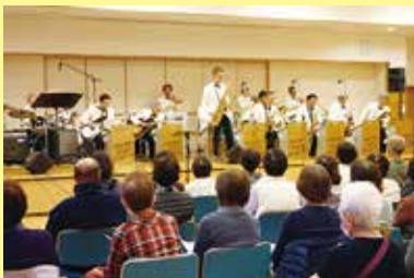
懐かしの昭和歌謡コンサート 3/2 (日) ことぶきクラブ連合会