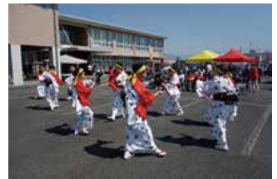
輪になろう中央市民のつどい 3/23 (日) 玉穂総合会館