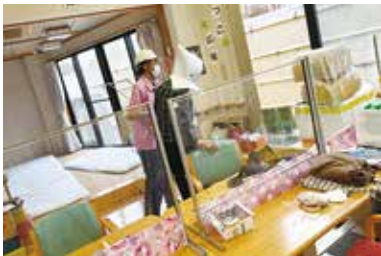
避難訓練 3/24 (月) シルクの里デイ・まゆっこ広場