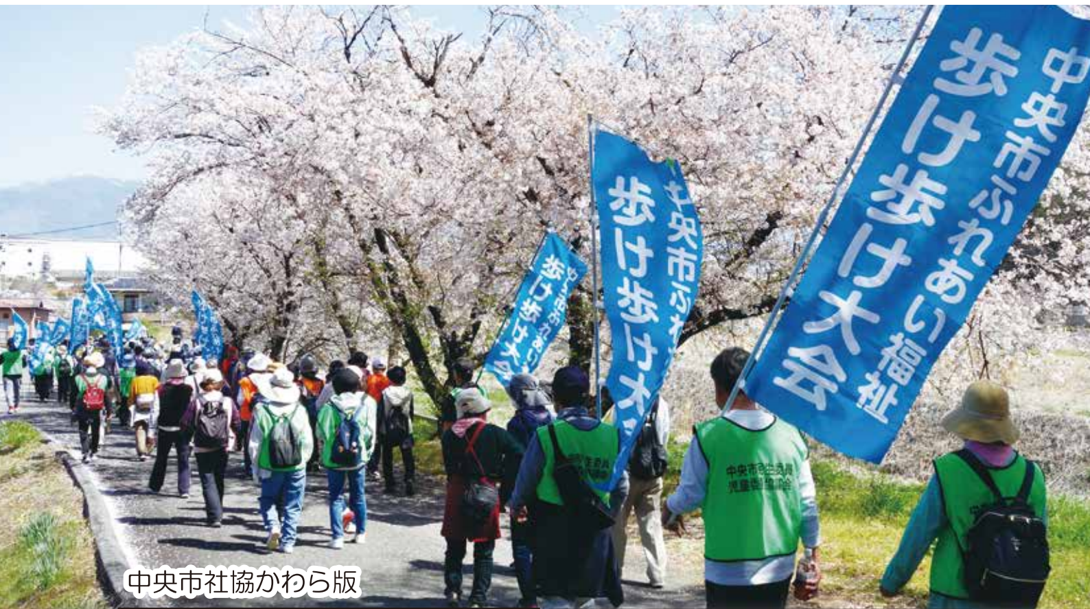
中央市社協かわら版