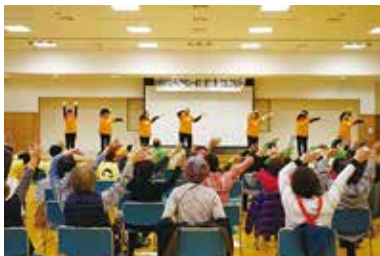
ボランティア活動推進