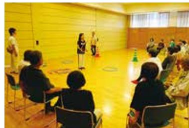
地域のできる レクリエーション講座

様々な事業の一部紹介です！今年度も様々な事業を企画していきますので是非ご協力をお願いします！また、地域での困りごとなど何かありましたらご相談ください。