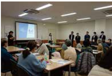
健康まなびや 『お金の教室』 3/12 (水) 玉穂総合会館