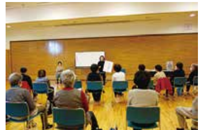
健康まなびや『レク教室』 3/26 (水) 玉穂総合会館