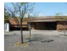
田富コミュニティセンター

田富コミュニティセンターでは、福祉公園とコミュニティセンターの管理事務を行っています。