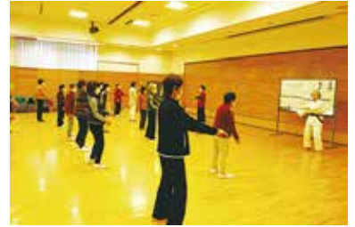
健康まなびや 『太極拳教室』 3/7 (金) 玉穂総合会館