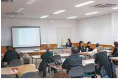
成年後見制度市民講座 2/18 (火) 玉穂総合会館