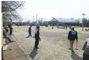
ふれあい福祉ゲートボール大会 3/25 (火) 福祉公園