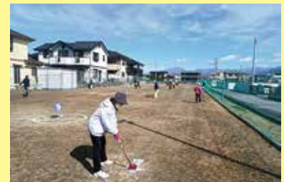
グラウンドゴルフ大会 3/18 (火) ことぶきマスター連絡協議会