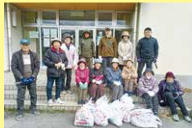
環境整備 3/6 (木) ことぶきマスター連絡協議会