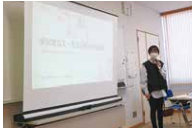
市民生活支援員養成講座 2/25 (火) 玉穂総合会館