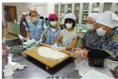
夏休みボランティア体験講座