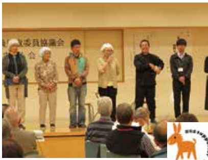
認知症サポーターしらさぎ劇団 11/15 (木) 民生委員児童委員協議会定例会