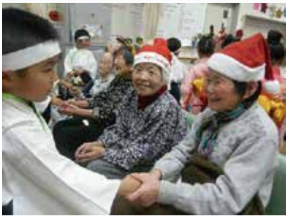
クリスマス会 (豊富保育園児披露) 12/4 (火)・5 (水) シルクデイ・まゆっこ広場