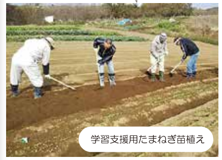
学習支援用たまねぎ苗植え