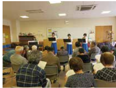
グリーンカフェ (シルクオカリーナ披露) 12/7 (金) 地域活動支援センターちゅうおう