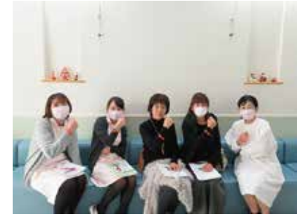
認知症サポーター養成講座 12/12 (水) 若葉クリニック