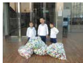
みかさこども園様