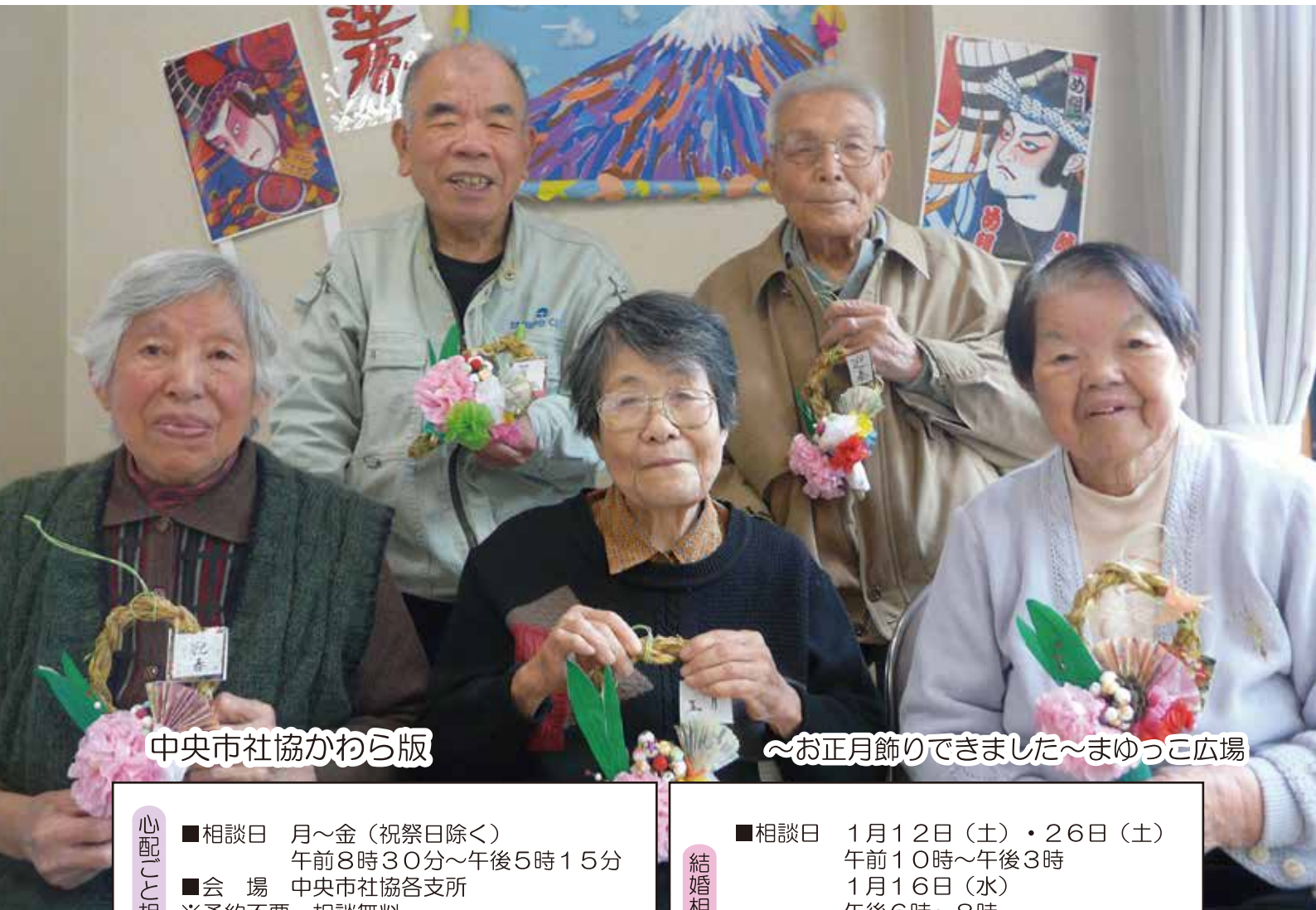
中央市社協かわら版