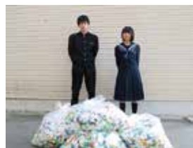
田富中学校福祉委員会様