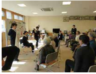
山梨大学医学部学生実習 11/21 (水) ふれあいサロン