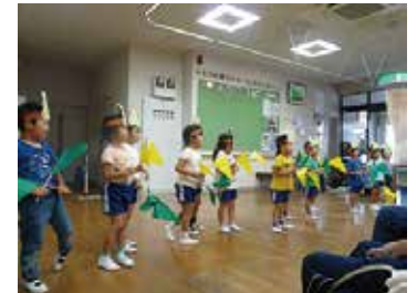
豊富保育園ぱんだ組 10/11 (木) シルクの里デイサービスセンター