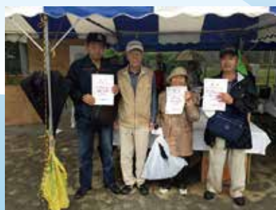
ペタンク ブロック1位 中央市①