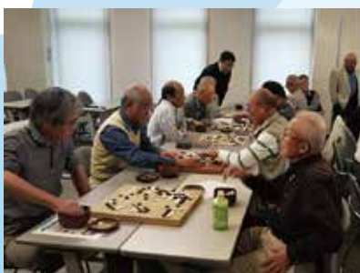
囲碁 Bパート第2位 中央市チーム