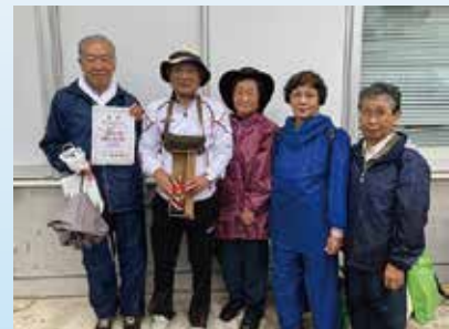
クイズウォーキング 2位 豊富チーム