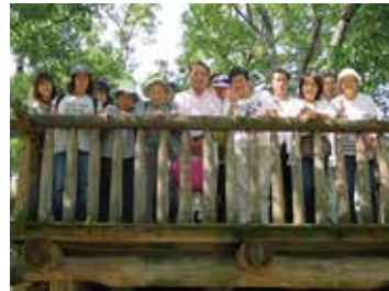
野外活動 (地活ちゅうおう) 9/19 (水) 富士川クラフトパーク