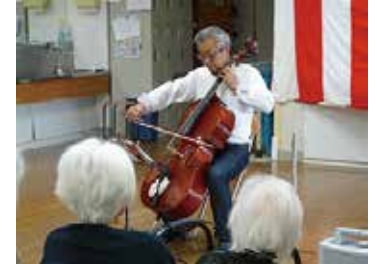
敬老会 (トウモロコシの収穫祭) 9/17 (月)～18 (火) シルクの里デイサービスセンター