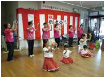
敬老会 (友遊&はなまるクラブ) 9/17 (月)～18 (火) シルクの里デイサービスセンター