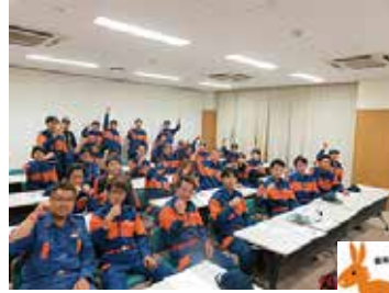
認知症サポーター養成講座 9/12 (水)・10/10 (水) 中央市消防団