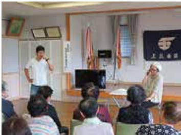
しらさぎ劇団 9/27 (木) 上三條ことぶきサロン