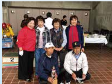
輪投げ ブロック1位 田富支会