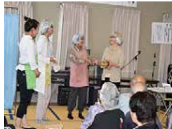
しらさぎ劇団 9/30 (日) 大鳥居自治会敬老会