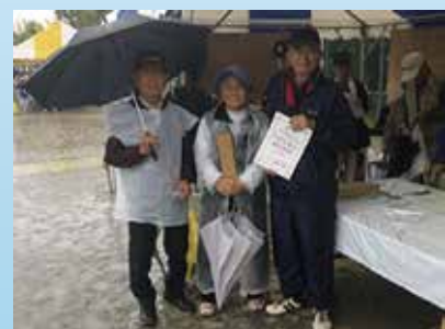
ペタンク ブロック1位 中央市②