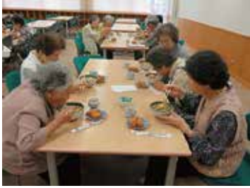
サロン合同食事会 9/4 (火) 玉穂総合会館