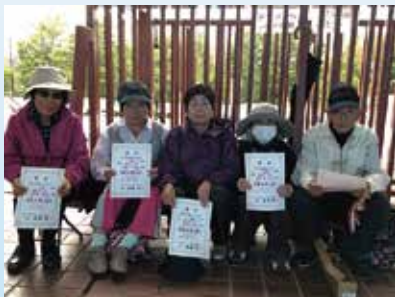
輪投げ ブロック1位 玉穂支会

「いきいき山梨ねんりんピック」は、山梨県社会福祉協議会が主催する高齢者のスポーツ大会で、1992年から毎年開かれています。今年は残念ながら悪天候の中でしたが、体力自慢の60歳以上の方を中心に、大勢の方が参加されました。中央市からは、6チームが入賞しました。おめでとうございます。