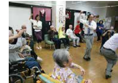
甲斐タンゴ倶楽部 9/22 (土) シルクの里デイサービスセンター