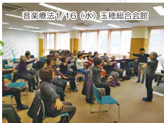
音楽療法1/16 (水) 玉穂総合会館