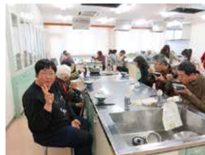
料理教室・カレーうどん 1/18 (金) 地域活動支援センターちゅうおう