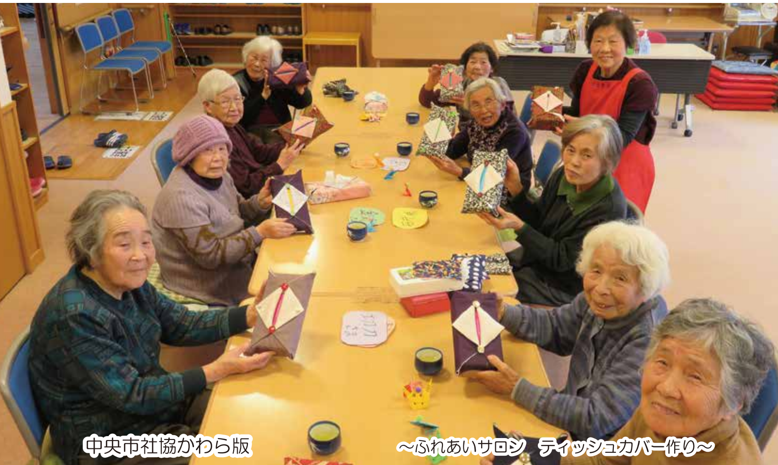
中央市社協かわら版