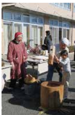
多世代交流会 もちつき 1/7 (月) 中央市ことぶきマスター連絡協議会