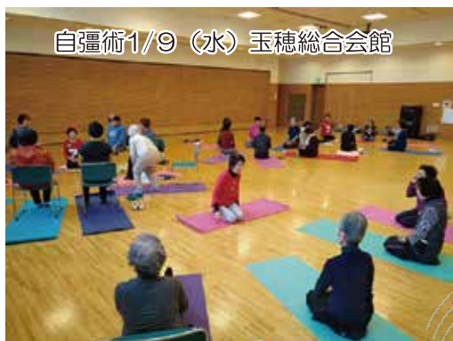
自彊術1/9 (水) 玉穂総合会館