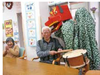
獅子舞 1/29 (火) シルクの里デイサービスセンター