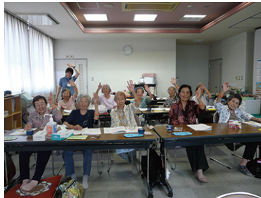
認知症サポーター養成講座 7/11 (火) ふれあいサロン中央豊富