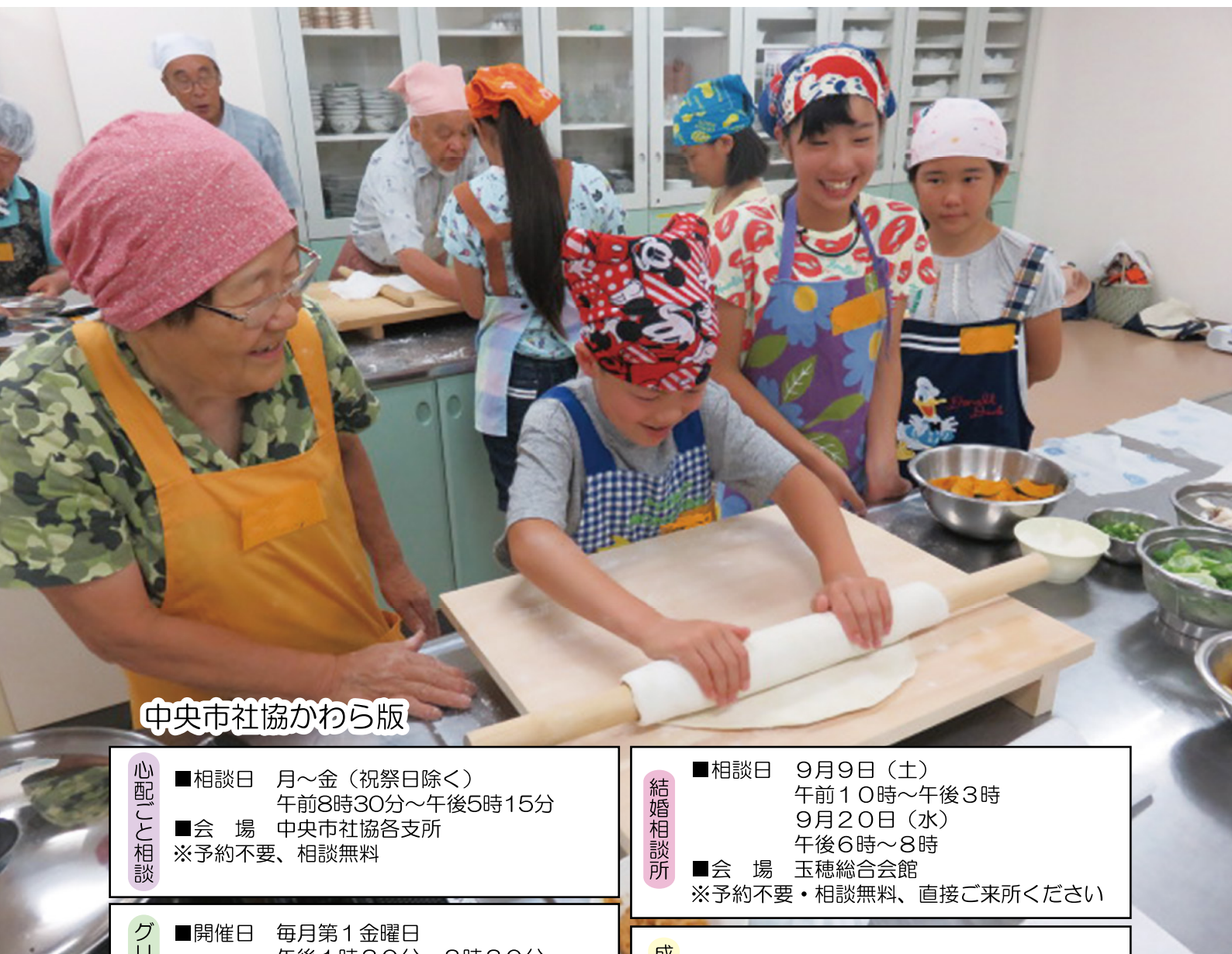
中央市社協かわら版