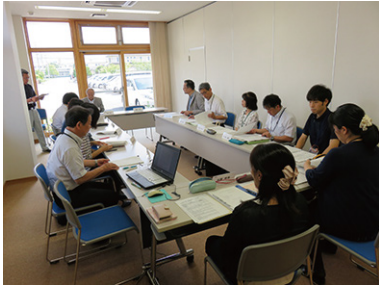
日常生活自立支援事業推進委員会 7/6 (木) 玉穂総合会館