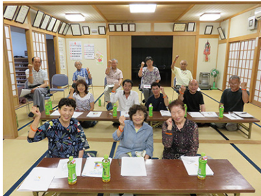
認知症サポーター養成講座 6/25 (日) 東花輪第1自治会