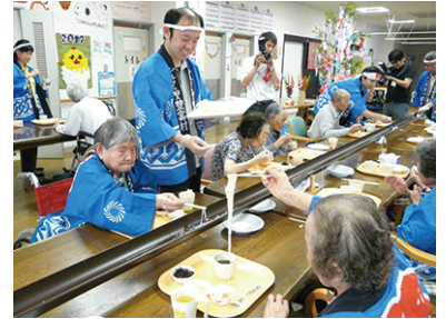
そうめん流し 7/3 (月)・4 (火) シルクの里デイ・まゆっこ広場