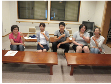
認知症サポーター養成講座 6/29 (木) 神明自治会