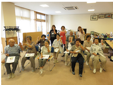
認知症サポーター養成講座 7/25 (火) ふれあいサロン中央