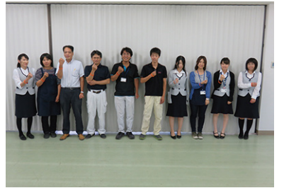
認知症サポーター養成講座 7/20 (木) JA中巨摩東部玉穂支店