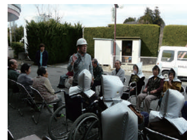
避難訓練 3/24 (金) シルクの里デイサービスセンター