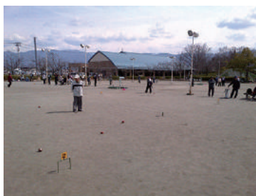
ふれあい福祉ゲートボール大会 3/23 (木) 田富福祉公園ゲートボール場