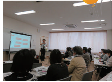
日常生活自立支援事業 生活支援員養成講座 2/28 (火) ~ 3/14 (火) 玉穂総合会館