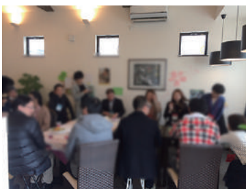
cafe.con (婚活パーティー) 3/18 (土) ウェル-all is well-