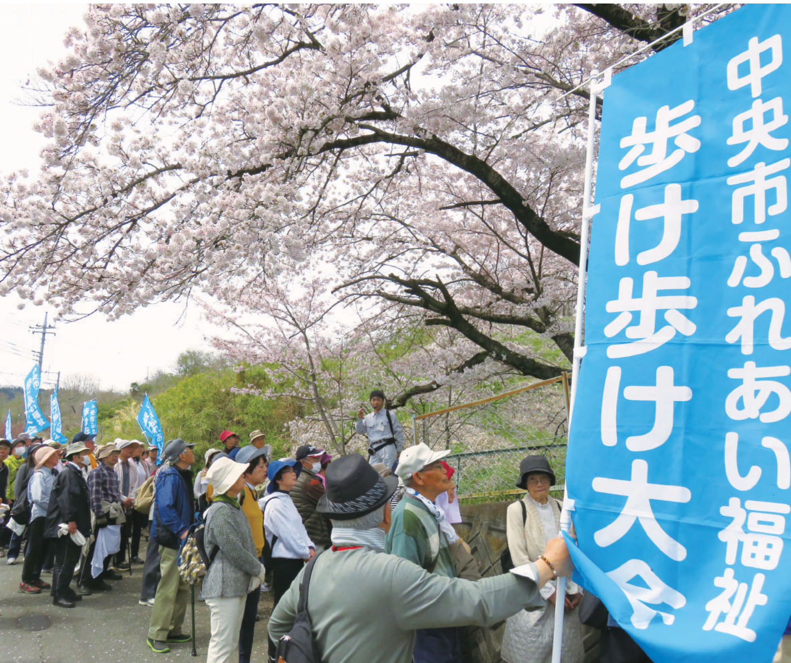
第11回 中央市ふれあい福祉歩け歩け大会（豊富地区）4月12日（水）