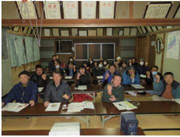
認知症サポーター養成講座 2/13 (月) 藤巻自治会