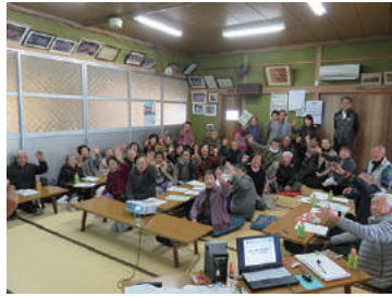
認知症サポーター養成講座 2/27 (月) 浅利自治会