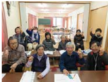
認知症サポーター養成講座 1/27 (金) 新城自治会