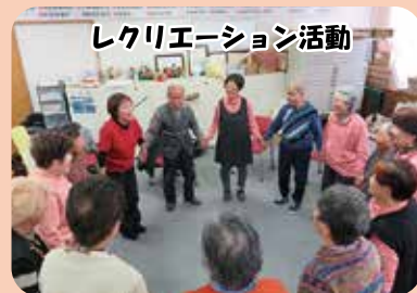
レクリエーション活動