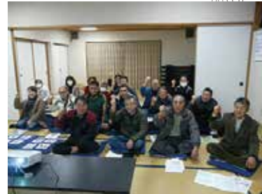
認知症サポーター養成講座 2/5 (日) 関原自治会