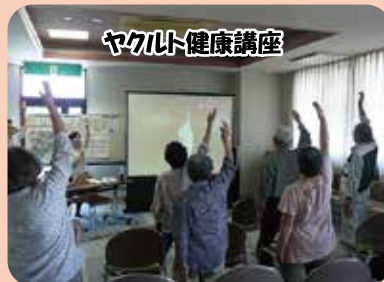
ヤクルト健康講座