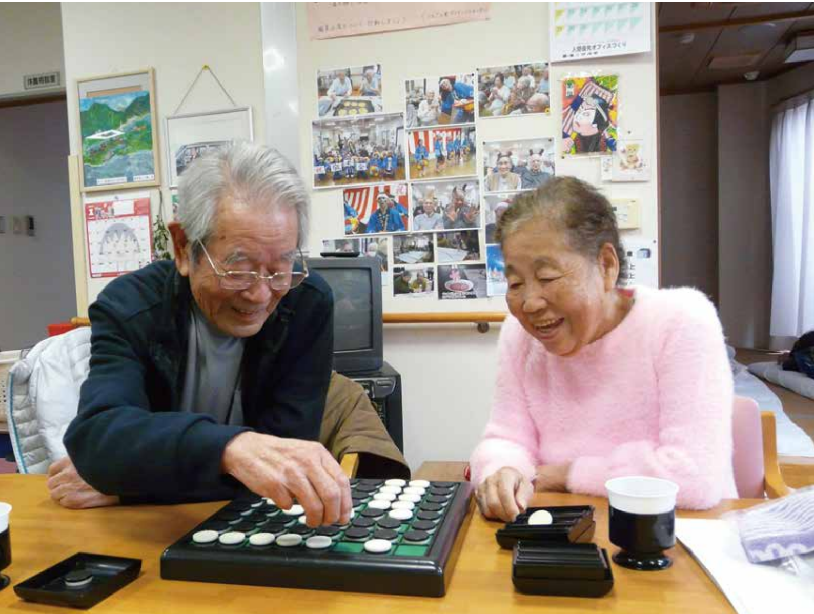
「私が教えるね」、92歳人生初めてのオセロ！ まゆっこ広場