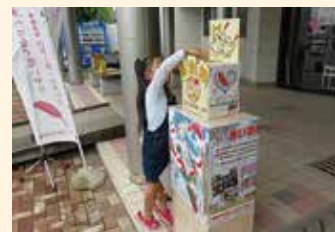
街頭募金活動(道の駅とよとみ)

中央市支会に寄せられた共同募金は、山梨県共同募金会へ集約されて、中央市及び山梨県内の地域福祉活動に役立てられます。また、募金の一部を準備金として蓄え、大規模災害が発生した際に、ボランティアセンターの運営等に役立てられます。中央市での募金の使いみちは、山梨県共同募金会のホームページ並びに、後日、社協だより「ぬくぬく」にて報告させていただきます。