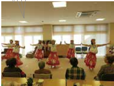
プアマナ中央 1/17 (火) ふれあいサロン中央