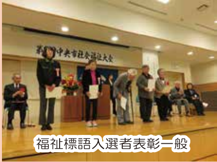
福祉標語入選者表彰一般