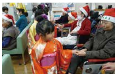
クリスマス会 (豊富保育園児お遊戯披露) 12/5 (月)・6 (火) シルクの里デイ・まゆっこ広場