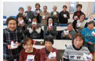
健康まなびや 干支づくり 12/13 (火)・15 (木) 玉穂総合会館