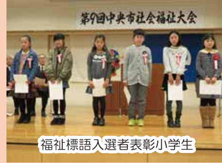
福祉標語入選者表彰小学生