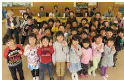
玉穂保育園児お遊戯披露 11/17 (木) ふれあいサロン中央