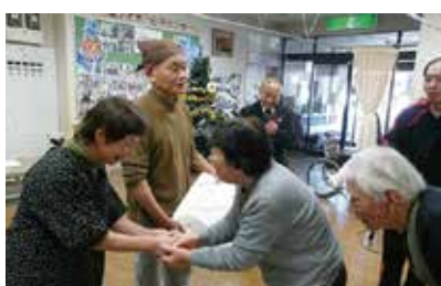
やまだ亭 そば打ち 12/14 (水) シルクの里デイ・まゆっこ広場