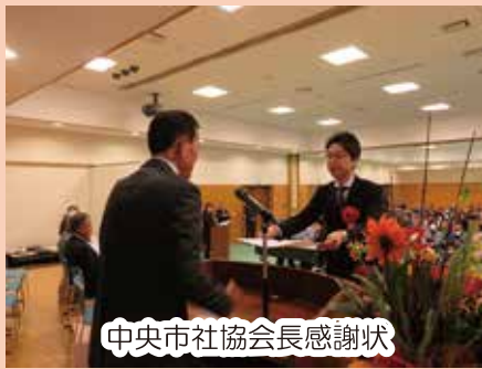
中央市社協会長感謝状