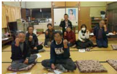
認知症サポーター養成講座 11/11 (金) 木原自治会