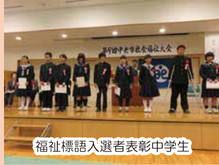
福祉標語入選者表彰中学生