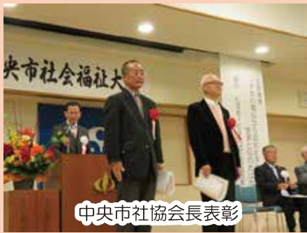
中央市社協会長表彰