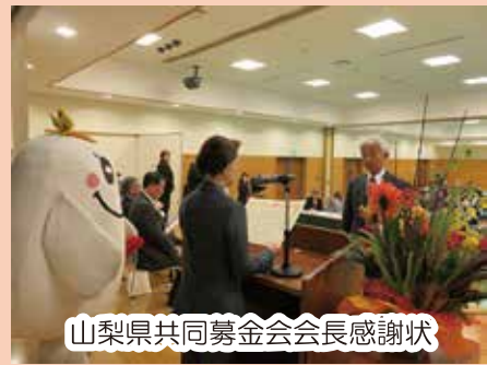
山梨県共同募金会会長感謝状