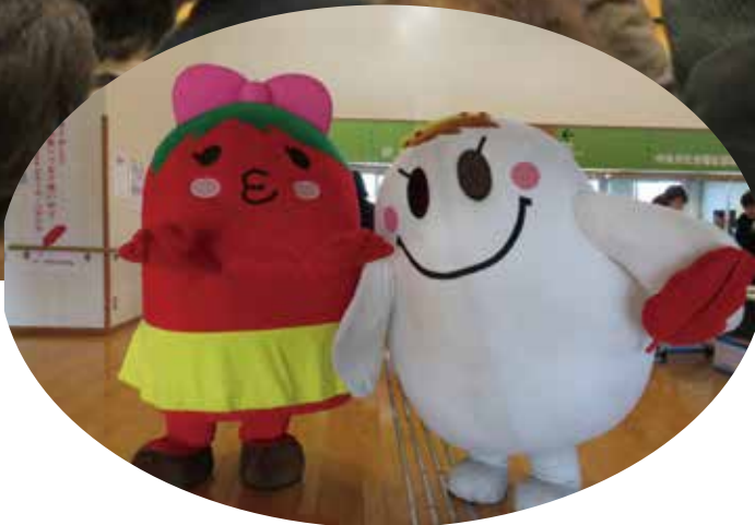
第9回 中央市社会福祉大会 12月11日(日)