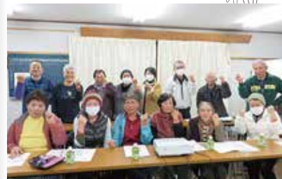
認知症サポーター養成講座 11/25 (金) 飛石自治会