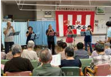
敬老会 9/18(月)~20(水) シルクの里デイサービスセンター