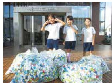
みかさこども園のおともだち