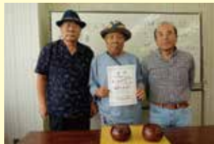
囲碁 B部門 2位 中央市チーム