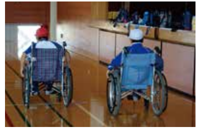
福祉教育(車いす体験) 10/10(火) 豊富小学校