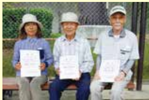
ペタンク ブロック2位 中央市③チーム

9月23日(土)小瀬スポーツ公園にて「いきいき山梨ねんりんピック」が開催されました。中央市からも大勢の方が参加されました。入賞された方々、おめでとうございます。