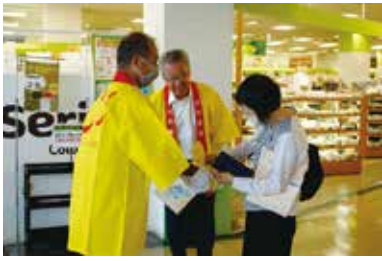
共同募金セレモニー・募金活動 10/5(木) いちやまマート玉穂店