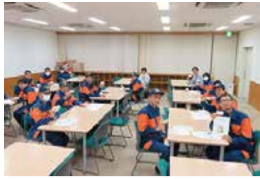
認知症サポーター養成講座 10/5(木) 中央市消防団