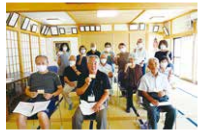
認知症サポーター養成講座 9/28(木) 東花輪第三自治会絆の会