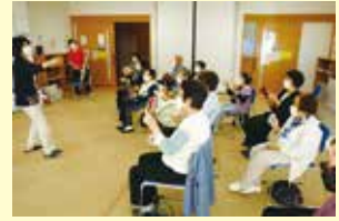
10/6 (金) 音楽療法 ことぶきクラブ玉穂支会女性部