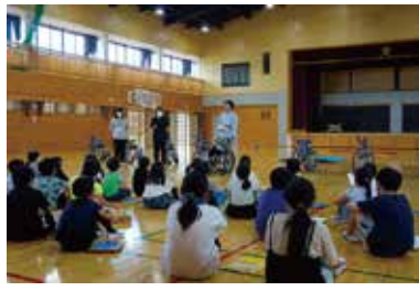
福祉教育(車いす体験) 9/26(火) 田富北小学校