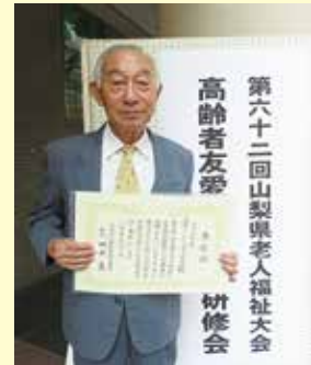
会員増加運動活動表彰 特別活動賞 中央市ことぶきクラブ 田富支会大田和 様