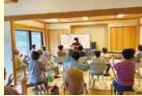
9/21 (木) やってみるじゃん教室 ことぶきクラブ豊富支会