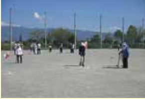
9/13 (水) グラウンドゴルフ大会 ことぶきクラブ田富支会