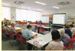
9/15 (金) 腸内環境改善講座 ことぶきマスター連絡協議会