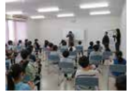
ボランティア体験事業