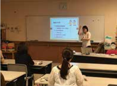
手話奉仕員養成講座 毎週金曜開講中 玉穂総合会館