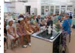
ボランティア体験事業