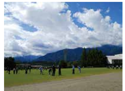
山身連グラウンドゴルフ大会 9/27 (日) 韮崎市営総合グラウンド