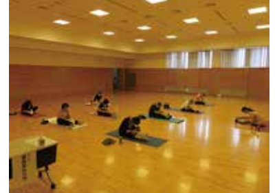
健康まなびや『ゆる体操』 9/16 (水) 玉穂総合会館