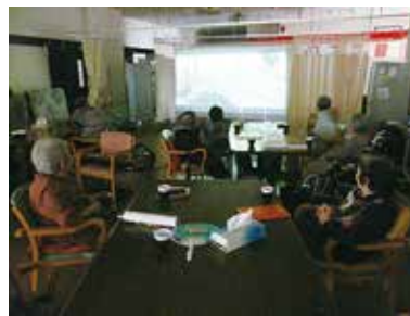
敬老会『映画上映』 9/21 (月)・22 (火) シルクの里デイサービスセンター