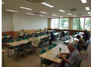
一人暮らし高齢者昼食会 9/2 (水) 玉穂総合会館