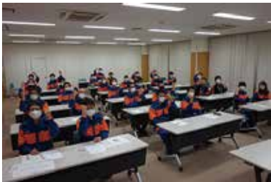
認知症サポーター養成講座 10/7 (水) 中央市消防団