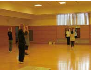
健康まなびや『気功教室』 9/18 (金) 玉穂総合会館