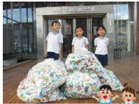
みかさこども園のおともだち