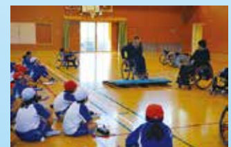
会費のつかいみち 市内小中学校での福祉講話

コロナ禍のため、本年度は職員による事業所様へのご協力依頼の訪問は控えさせていただきますが、会費のご納入にご賛同いただける事業所・企業様におかれましては、下記連絡先にご連絡いただけましたら、直接職員が訪問させていただきます。何卒、ご理解、ご協力の程よろしくようお願い申し上げます。