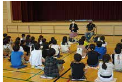
福祉教育 10/6 (火)・10/12 (月) 三村小学校・田富北小学校