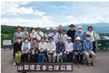
花卉先進地視察研修 6/29（木） ことぶきクラブ玉穂支会