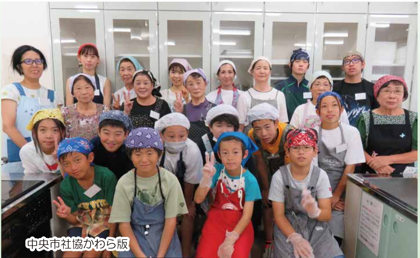
中央市社協かわら版