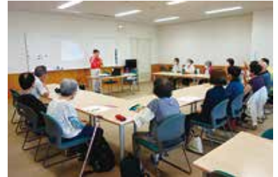
健康まなびや「ゆるゆる英会話」 7/12（水） 玉穂総合会館