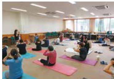
健康まなびや「背骨コンディ ショニング」 7/19（水）玉穂総合会館