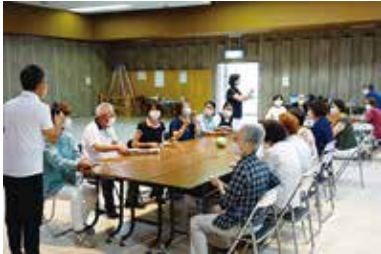
地域でできるレクリエーション 講座（レク） 7/4（火）田富総合会館