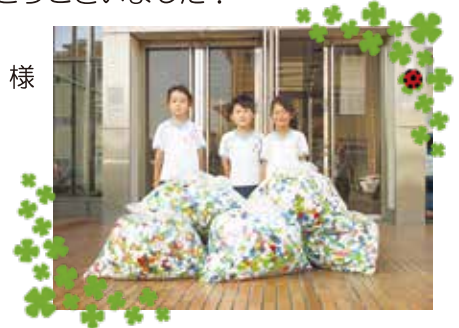
みかさこども園のおともだち