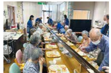
そうめん流し 7/24（月）、25（火） シルクの里デイサービス