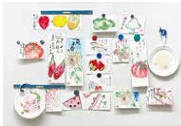
絵手紙教室 7/5（水） ことぶきクラブ玉穂支会女性部