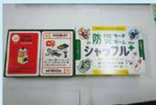
地域交流用備品貸出