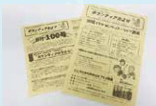
ボランティアだよりの発行