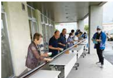
そうめん流し 7/13（木） ふれあいサロン