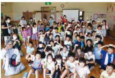
認知症キッズサポーター 7/25（火） 西部児童館