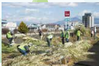
ボランティア活動支援