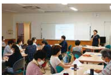
健康まなびや「口腔体操」 7/26（水） 玉穂総合会館