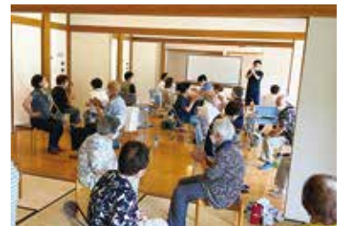
やってみるじゃん教室 8/3（木） ことぶきクラブ豊富支会