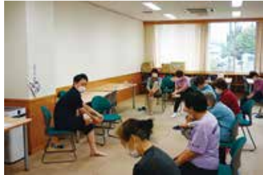
健康まなびや「筋トレ体操」 7/5（水） 玉穂総合会館