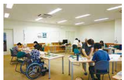
中央市障害者福祉会創作活動 7/8（土）、29（土） 玉穂総合会館