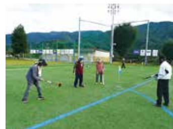
ことぶきクラブ豊富支会