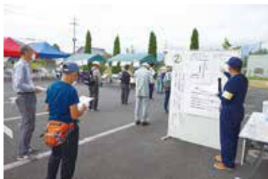
災害ボランティアセンター 運営協力員養成講座