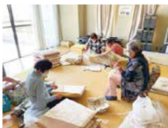
豊富ボランティアの会