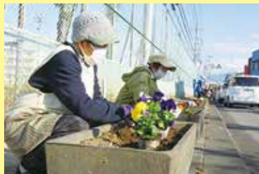
環境美化活動花植え 3/2 (木) ことぶきクラブ連合会玉穂支会