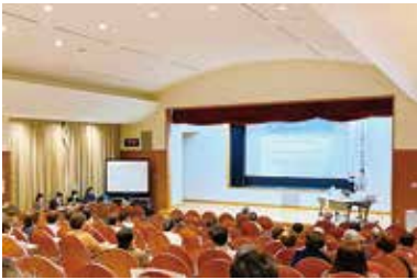
中央市社会福祉大会 3/18 (土) 玉穂生涯学習館