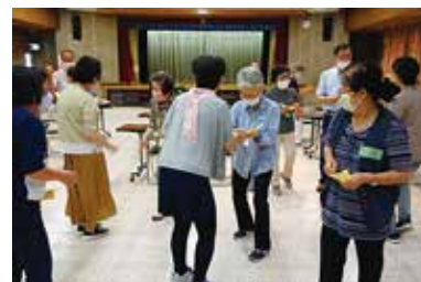
地域でできる レクリエーション講座

様々な事業の一部紹介です！今年度も様々な事業を企画していきますので是非ご協力をお願いします！また、地域での困りごとなど何かありましたらご相談ください。