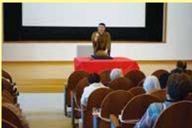
落語鑑賞会 2/16 (木) ことぶきクラブ連合会女性部