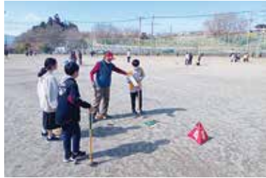
ふれあい福祉グラウンドゴルフ大会 3/20 (月) 豊富小学校