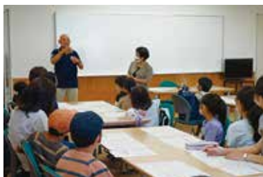
夏休みボランティア体験講座