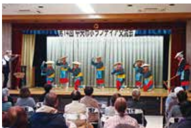
ボランティア活動推進