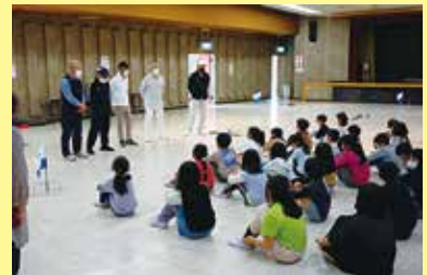
児童館多世代交流会 3/30 (木) ことぶきマスター連絡協議会