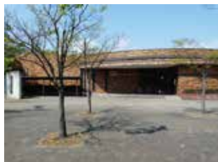
田富コミュニティセンター