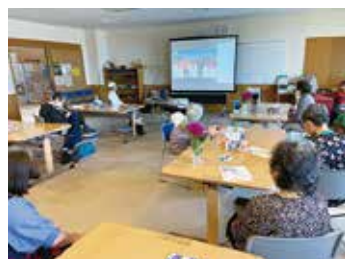
リモート体操教室