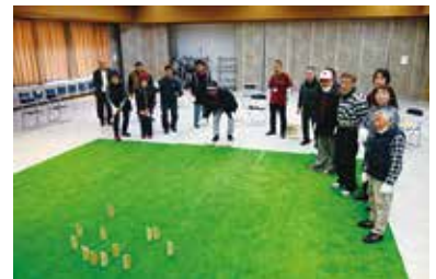
↑スポーツ教室（モルック）