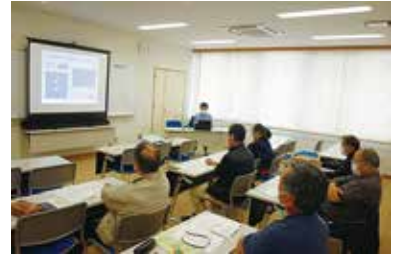
運転ボランティア養成講座 3/24 (金) 玉穂総合会館