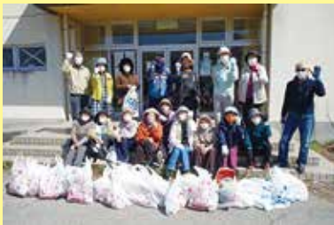
環境整備&健康ウォーキング交流会 3/20 (月) ことぶきマスター連絡協議会