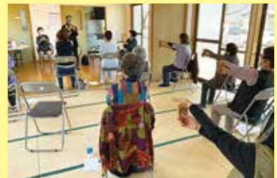
気功ストレッチ教室 3/10 (金) ことぶきクラブ連合会豊富支会