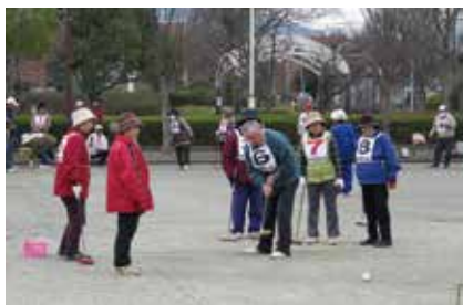
ふれあい福祉ゲートボール大会 3/23 (水) 田富福祉公園ゲートボール場