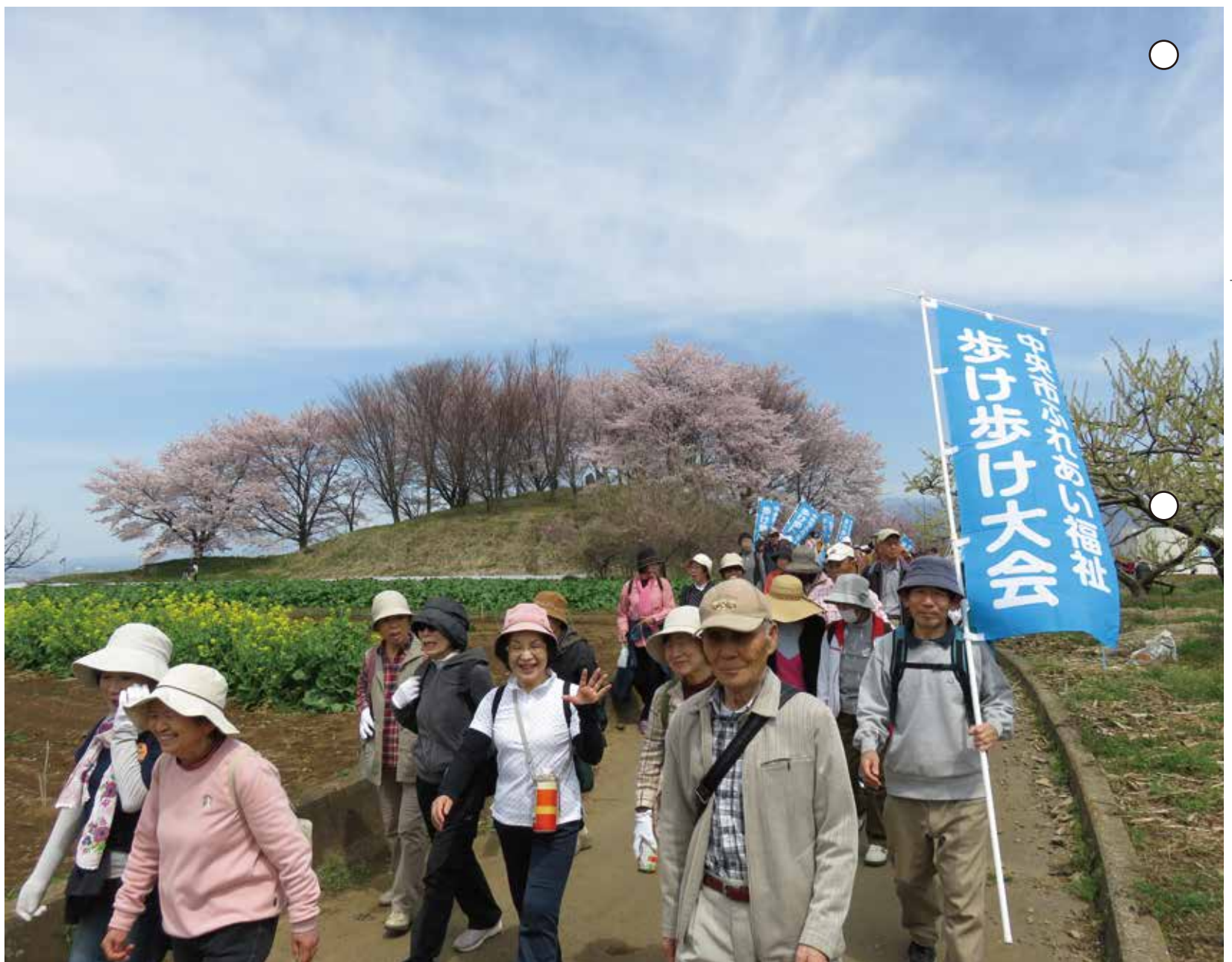
第10回 中央市ふれあい福祉歩け歩け大会(豊富地区) 4月6日