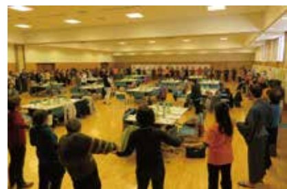
第9回中央市ボランティア交流会 2/28 (日) 玉穂総合会館