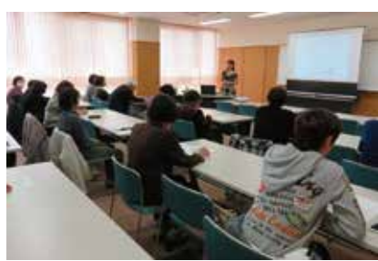
中央市福祉講演会 3/13 (日) 玉穂総合会館