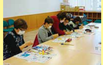
ご縁を結ぶ亀さんキーホルダー作り 1/31（火）