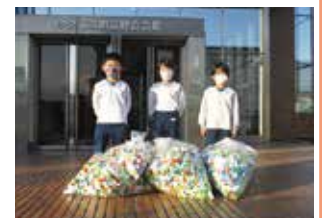
みかさこども園 様