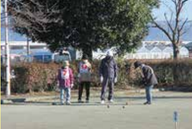
ゲートボール大会 12/7（水）