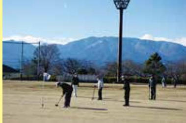
グラウンドゴルフ大会 12/19（月）