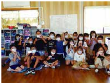
認知症キッズサポーター養成講座 9/26 (月) 田富中央児童館