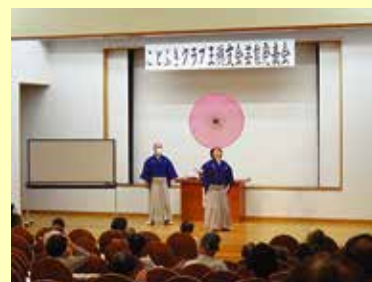
9/28 (水) 中央市ことぶきクラブ玉穂支会 芸能鑑賞会