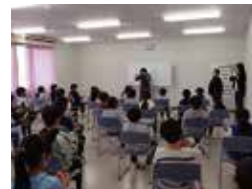
ボランティア体験事業