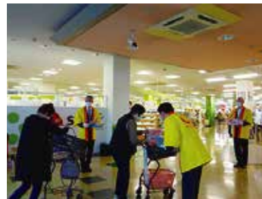
共同募金セシモニー・募金活動 10/6 (木) いちやまマート玉穂店