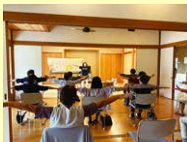
9/22 (木) 中央市ことぶきクラブ豊富支会 やってみるじゃん教室