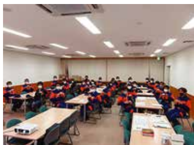
認知症サポーター養成講座 10/6 (木) 中央市消防団