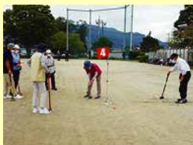
9/22 (木) 中央市ことぶきクラブ連合会 グラウンドゴルフ大会