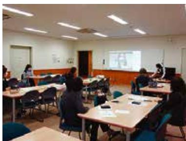
VOスキルアップZOOM講座 10/6 (木) 玉穂総合会館