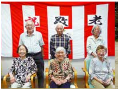
敬老会 9/15 (木)・16 (金) まゆっこ広場