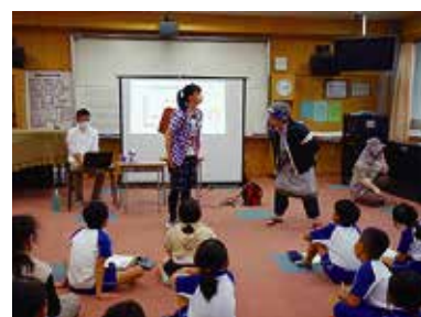
認知症キッズサポーター養成講座 10/13 (木) 豊富小学校