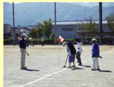
9/14 (水) 中央市ことぶきクラブ田富支会 グラウンドゴルフ大会