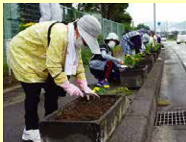
9/8 (木) 中央市ことぶきクラブ玉穂支会 環境美化・花植え作業