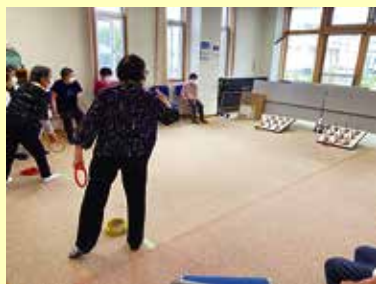
9/7 (水) 中央市ことぶきクラブ玉穂支会 女性部 輪投げ大会