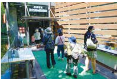
ひとり親家庭福祉会県内研修 7/31（日） 忍野・河口湖方面