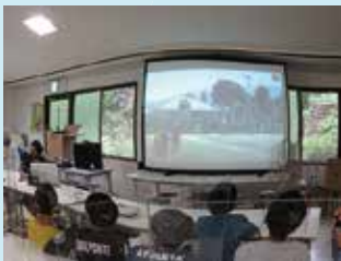
地域交流用備品貸出