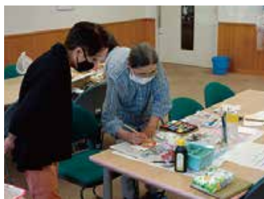
絵手紙教室 7/1（金） ことぶきクラブ玉穂支会女性部