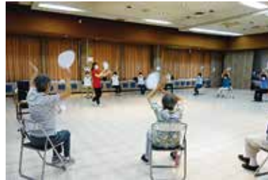
まなびや「ミュージックケア」 7/19（火） 田富総合会館