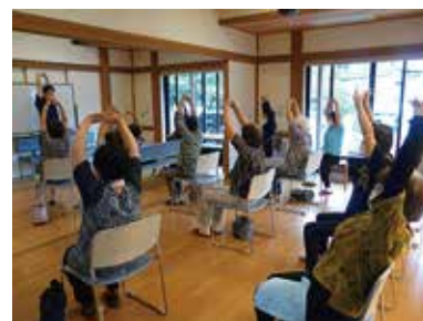
やってみるじゃん教室 7/14（木） ことぶきクラブ豊富支会