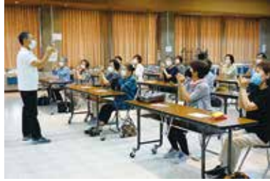
地域でできるレクリエーション 講座（レク） 7/5（火）田富総合会館