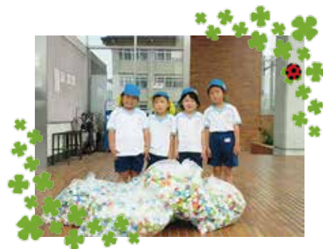
みかさこども園のおともだち