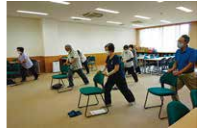
まなびや「骨アップ教室」 7/27（水） 玉穂総合会館