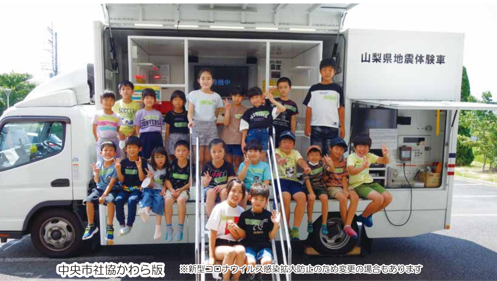
中央市社協かわら版 ※新型コロナウイルス感染拡大防止のため変更の場合もあります