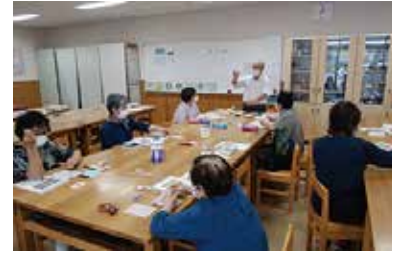
まなびや「消しゴムはんこ作り」 7/5（火） 玉穂総合会館