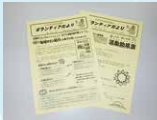
ボランティアだよりの発行