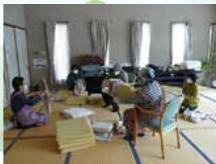
ボランティア活動支援