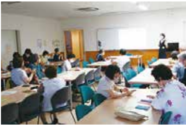
まなびや「スマホ教室（LINE）」 7/14（木） 玉穂総合会館