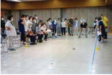
地域でできるレクリエーション 講座（カーリンコン） 6/29（水）田富総合会館