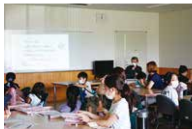
夏休みボランティア体験講座 8/9（火） 玉穂総合会館