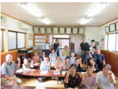
認知症サポーター養成講座 9/29（木） 東自治会