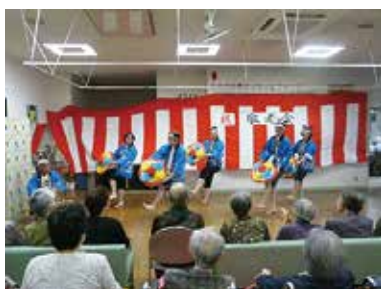
敬老会「井之口笠踊り披露」 9/20（火）・21（水） シルクの里デイサービスセンター