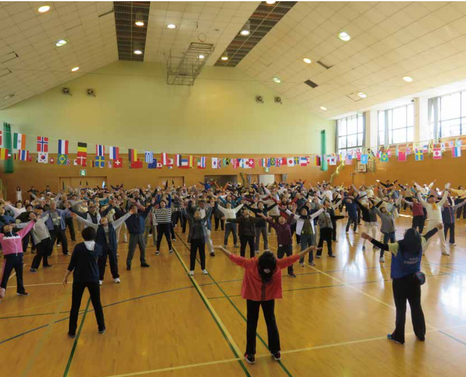
第10回 中央市ふれあい福祉運動会 10月15日 (土)