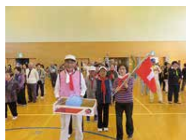
中央市ふれあい福祉運動会 10/15（土） 田富市民体育館