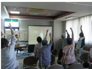
一人暮らし高齢者昼食会 ヤクルト「ウン知育教室」 8/31（水） 豊富健康福祉センター