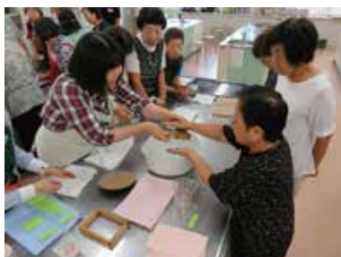
健康まなびや 手漉きはがき教室 9/13（火） 玉穂総合会館