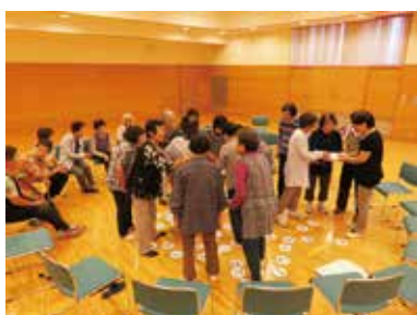
健康まなびや レク教室 9/21（水） 玉穂総合会館