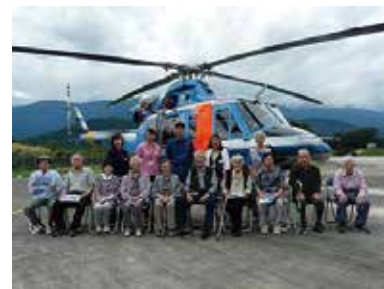
まゆっこ広場〇〇へ出かけよう！ 9/26（月） 県警察本部航空隊基地