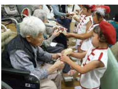
豊富保育園きりん組マーチング披露 10/13（木） シルクの里デイサービスセンター