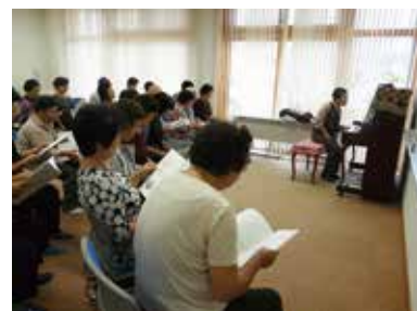
健康まなびや 歌声教室 9/14（水） 玉穂総合会館