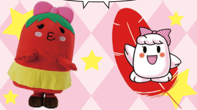
中央市商工会キャラクター「とまチュウ」