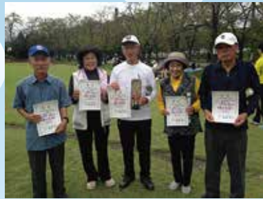
輪投げ 豊富チーム