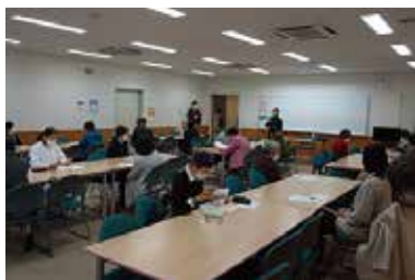
ボランティア活動推進