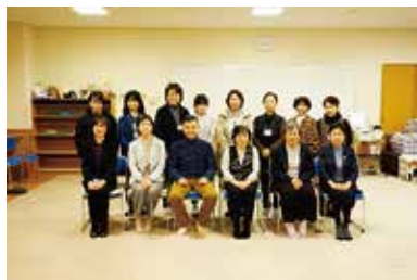
手話奉仕員養成講座 閉校式 3/18 (金) 玉穂総合会館