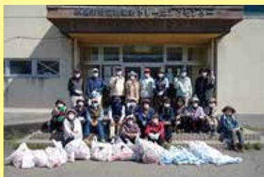
環境整備 3/24 (木) ことぶきマスター連絡協議会