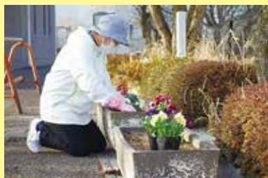
玉穂支会 花植え 3/17 (木) ことぶきクラブ連合会