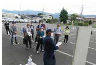
災害ボランティアセンター 運営協力員養成講座