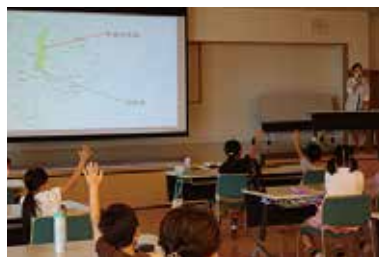
夏休みボランティア体験講座