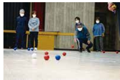
ボッチャ教室及び競技大会

様々な事業の一部紹介です！感染症対策を徹底しながら事業を行ってきました。まだまだ大きなイベント等は中止をせざるを得ない状況です。しかし、こんな時期だからこそ地域の助け合いが必要です。地域での困りごとなど何かありましたらご相談ください。