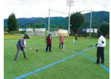
ことぶきクラブ豊富支会