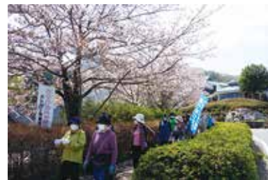
ふれあい福祉歩け歩け大会 4/7 (木) 豊富地区