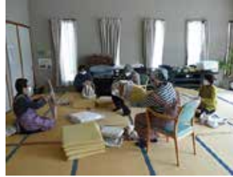
豊富ボランティアの会