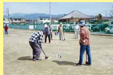
グラウンドゴルフ交流会 3/25 (金) ことぶきマスター連絡協議会