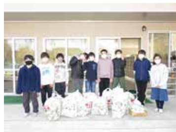
田富北小ボランティア委員会 様