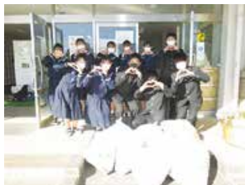
田富中福祉委員会 様