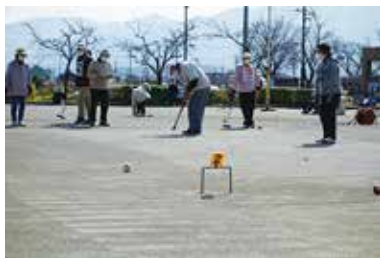
ふれあい福祉ゲートボール大会 3/25 (金) 田富福祉公園