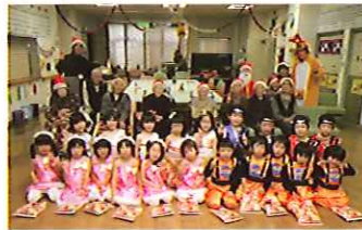
豊富保育園児慰問 ばんだ組 12/10 シルクの里デイサービスセンター