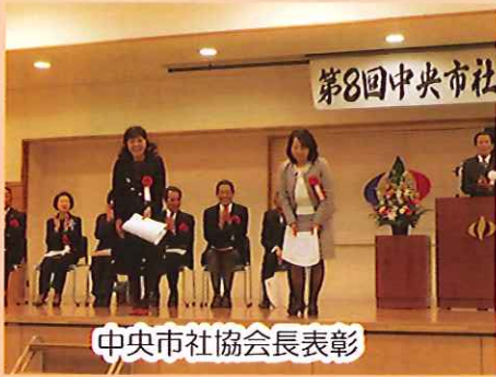
中央市社協会会長表彰