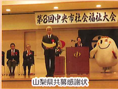
山梨県共募感謝状