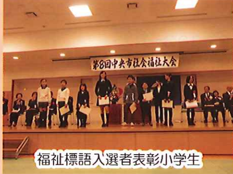
福祉標語入選者表彰小学生