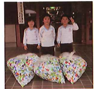
みかさこども園 様