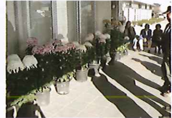
ことぶきマスター 菊観賞会 11/6 玉穂総合会館