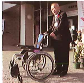
マックスバリュ東海(株) 様

11月3日（火）稲穂まつり会場内で、共同募金活動・バザーを実施し、158,815円となり、全額共同募金会へと寄付いたしました。ありがとうございました。