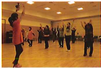
健康まなびや ゆるエアロ 12/9 玉穂総合会館