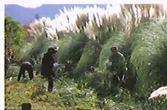
てんとう虫会・花壇環境整備 11/27 田富地区