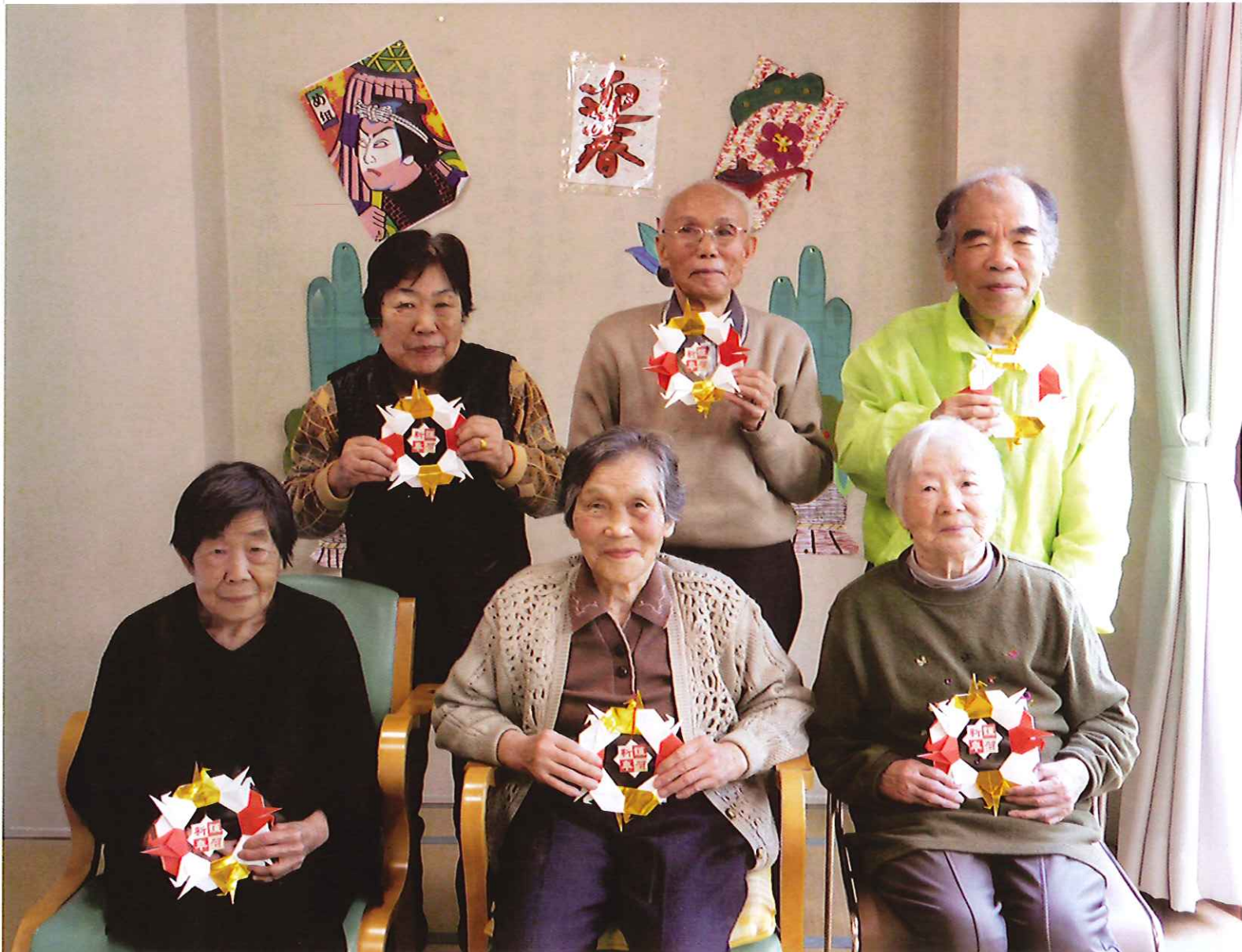
コミュニティサロン（まゆっこ広場）お正月かざり製作