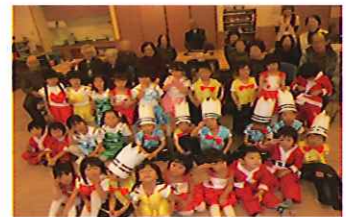
玉穂保育園児慰問 うさぎ組 12/17 ふれあいサロン