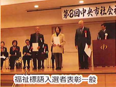
福祉標語入選者表彰一般