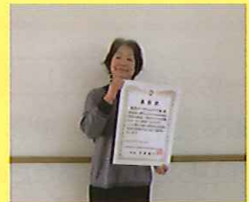
朗読サークルみすず会