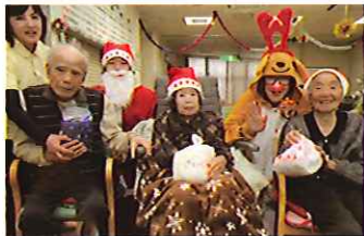
クリスマス会 12/9・10 シルクの里デイサービスセンター