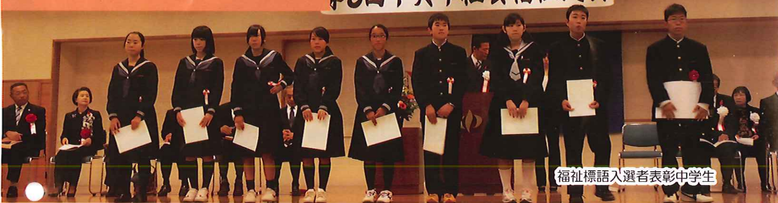
福祉標語入選者表彰中学生