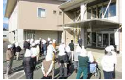
防災訓練 1/17 (月) 玉穂総合会館