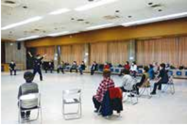
健康まなびや『笑いの筋トレ』 1/12 (水) 田富総合会館