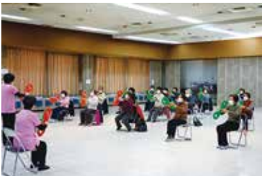
健康まなびや『3B体操』 2/2 (水) 玉穂総合会館