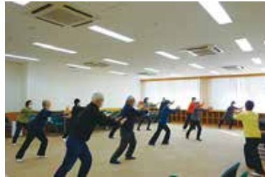
健康まなびや『気功教室』 1/21 (金) 玉穂総合会館