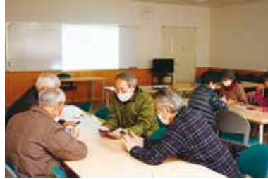
健康まなびや『スマホ教室』 1/13 (木)・27 (木) 玉穂総合会館