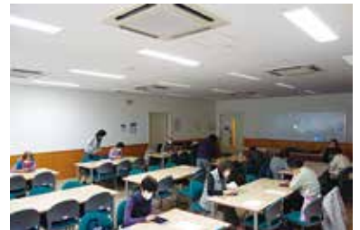
脳若返り教室 2/8 (火) 玉穂総合会館