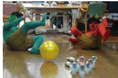
節分「ボーリングで鬼退治!!」 2/7 (月)～2/9 (水) シルクの里デイ・まゆっこ広場