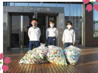
みかさこども園のおともだち

みなさんからの写真大募集中！ 詳細は『ぬくぬく1月号No.88』 またはHPをご覧ください！