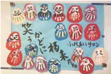
壁画づくり 1/19 (水) ふれあいサロン