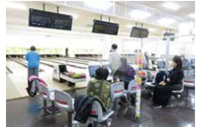
ボウリング大会 1/22 (土) 中央市障害者福祉会