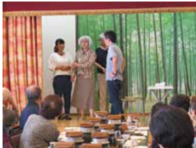
認知症サポーターしらさぎ劇団 9/15 (日) 木原自治会