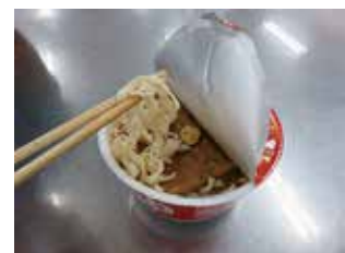
・うどんタイプの物

味はどれも全く問題ありません。冷たい麺を食べているような感じで、美味しかったです。