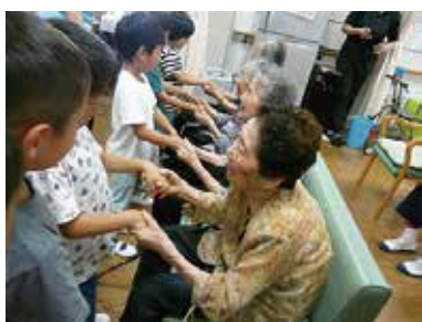
敬老会 (豊富保育園) 9/9 (月) シルクの里デイサービスセンター