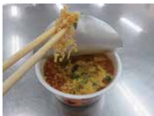
・麺に味のついている物