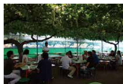
婚活パーティー 9/8 (日) 御坂農園グレープハウス