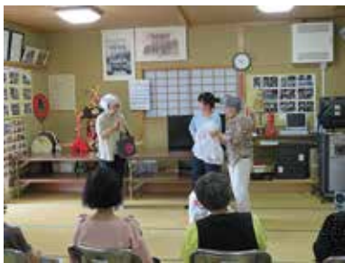
認知症サポーターしらさぎ劇団 8/22 (木) 乙黒達者会