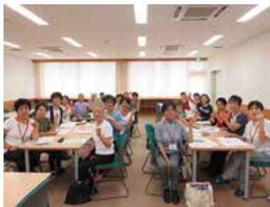
認知症サポーター養成講座 8/29 (木) げんき会