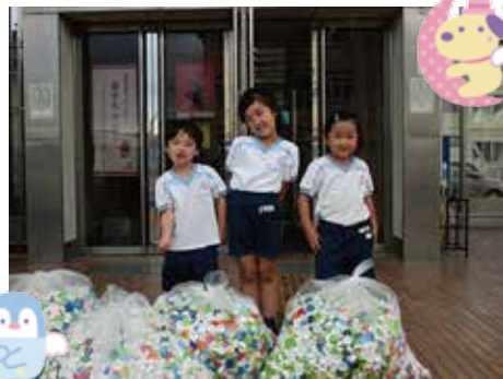
みかさこども園のおともだち