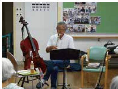
敬老会 (トゥーレモドゥイクスプレッション) 9/13 (金) シルクの里デイサービスセンター