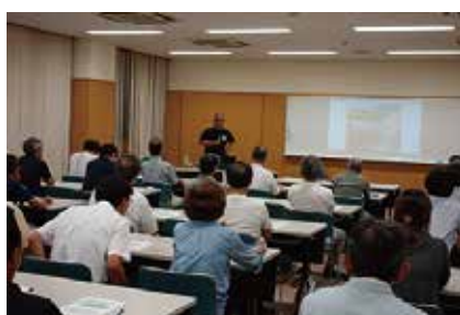
災害ボランティアセンター運営協力員養成講座 9/11 (水)、12 (木)、14 (土) 玉穂総合会館・玉穂生涯学習館駐車場