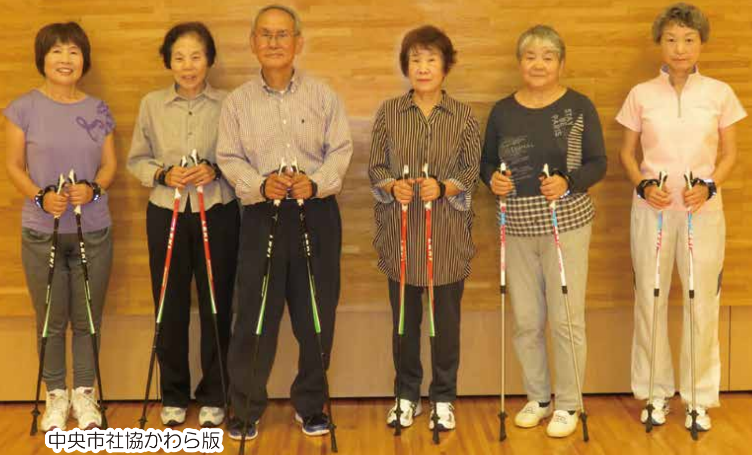
中央市社協かわら版