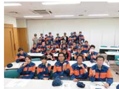
認知症サポーター養成講座 9/19 (木) 中央市消防団