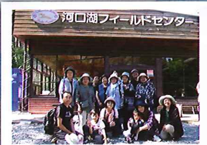
中央市母子寡婦福祉会 母子のつどい 7/11 河口湖フィールドセンター