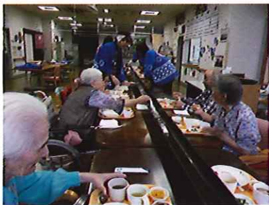
シルクの里デイサービスセンター 7/6・7 ソーメン流し