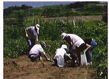
畑楽人・地域活動支援センター 芋堀り、ラディッシュ収穫 7/14 豊富地区(大鳥居)