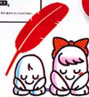
共同募金キャラクター 愛ちゃんと希望くん

平成27年度の中央市の目標額は 5,971,000円 です！ご協力よろしくお願い致します！