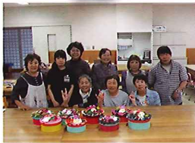
中央市障害者福祉会 ふれあい創作活動 7/5 玉穂総合会館