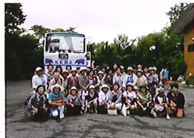
中央市母子寡婦福祉会 県内研修 8/8 山中湖方面