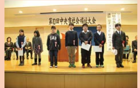
福祉標語入選者表彰小学生