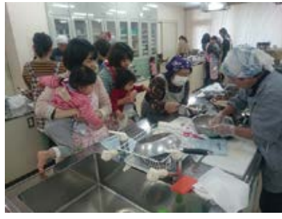
多世代交流おやき作り 11/15（水） 中央市ことぶきマスター連絡協議会