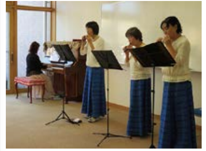
ふれあいサロン ～シルクオカリーナ演奏～ 12/13（水）玉穂総合会館