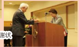
山梨県共同募金会会長感謝状