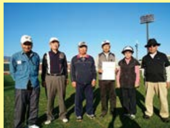
11/7（火）小瀬スポーツ公園