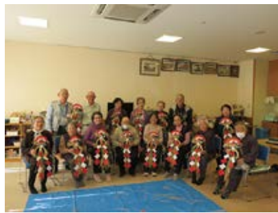
ふれあいサロンしめ縄作り 12/12（火） 玉穂総合会館