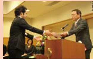
中央市社協会長感謝状