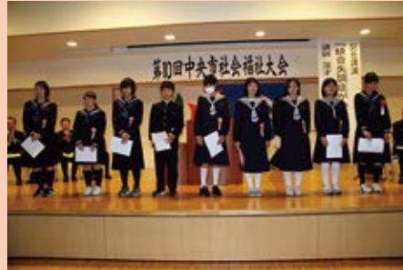
福祉標語入選者表彰中学生