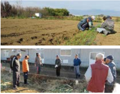
畑楽人（はたらくひと）事業 11/13（月）・12/11（月） 豊富地区大鳥居