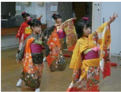
クリスマス会（豊富保育園児披露） 12/4（月）・5（火） シルクデイ・まゆっこ広場