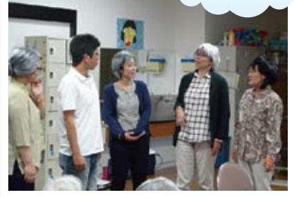
認知症サポーター劇 11/17（金） シルクデイ・ふれあいサロン