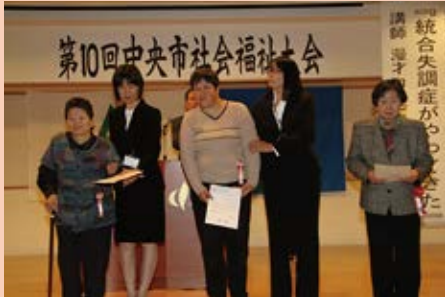
福祉標語入選者表彰一般