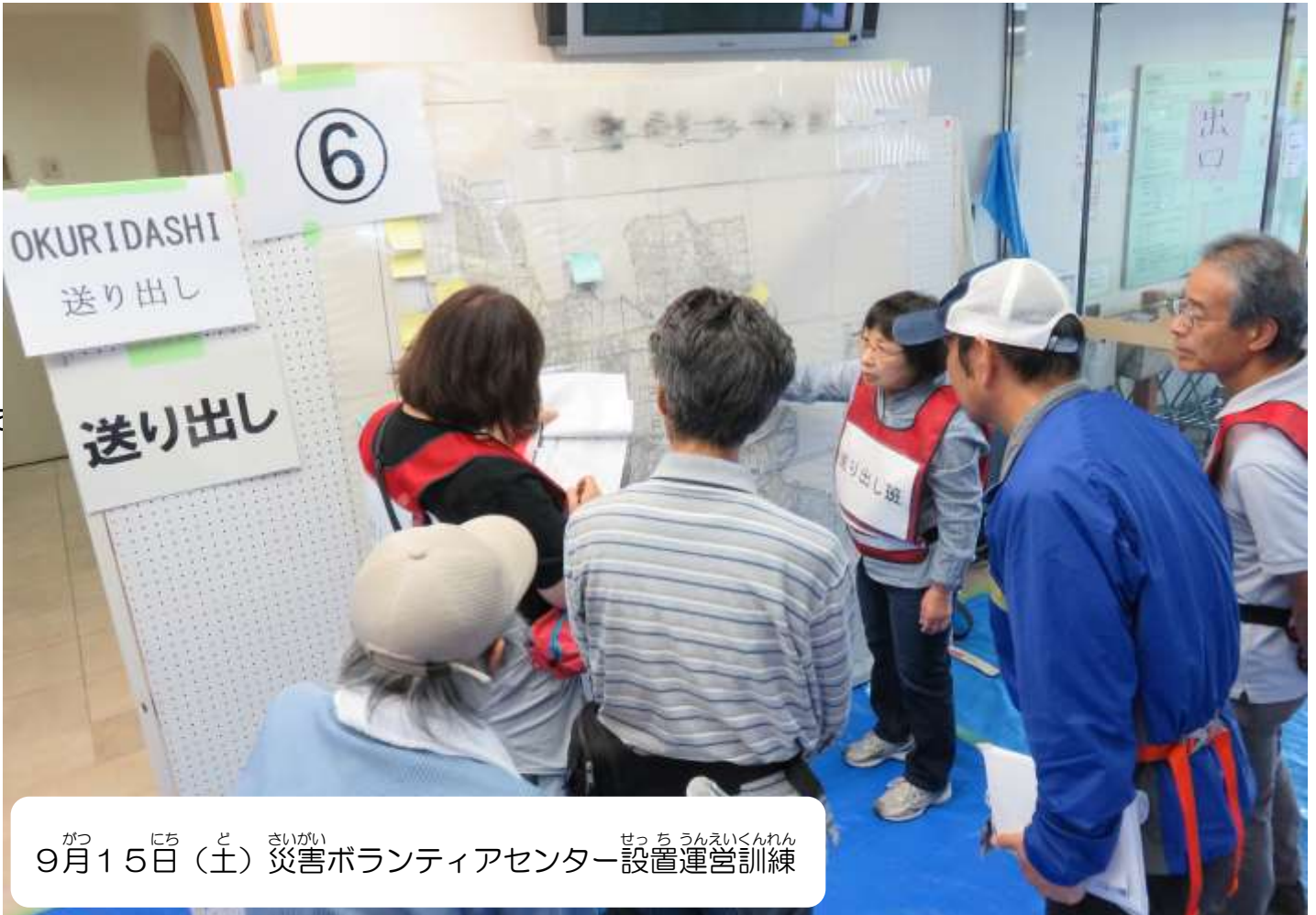
9月15日（土）災害ボランティアセンター設置運営訓練