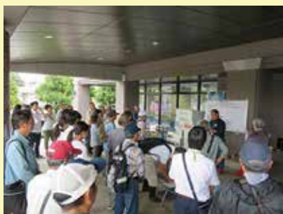
災害ボランティア養成講座