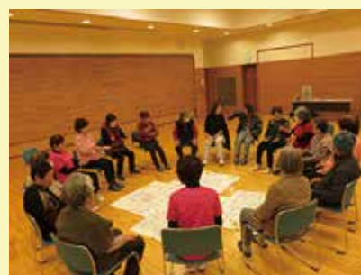
ボランティア活動推進

その他、ひとり親家庭福祉会・障害者福祉会・各種ボランティア団体の補助金として、また高齢者・障がい者・母子父子寡婦の方々を対象とした各種地域福祉事業を実施しております。