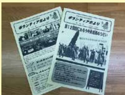
ボランティアだより発行