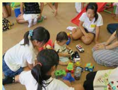
夏休みボランティア体験講座